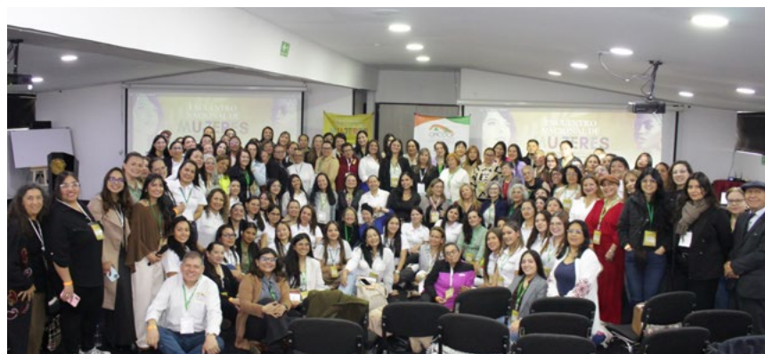
Encuentro Nacional de Mujeres del Sector Social y Solidario 2026.