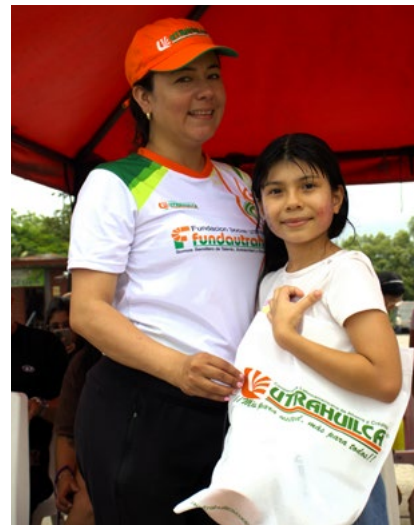
Kits utrahuilqueños se entregaron al concluir la actividad

El 25 de abril es el Día del Niño en Colombia y, además, es el recordatorio de que en la ciudad existen entidades dispuestas a reorganizarse y trabajar de la mano para que el futuro, representado en esas risas que llenaron el 'Salón Frutal', crezca en un entorno de protección, alegría y valores cooperativos.