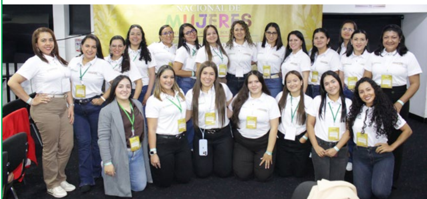
UTRAHUILCA y FUNDAUTRAHUILCA hicieron presencia en el encuentro con la participación de 22 mujeres.