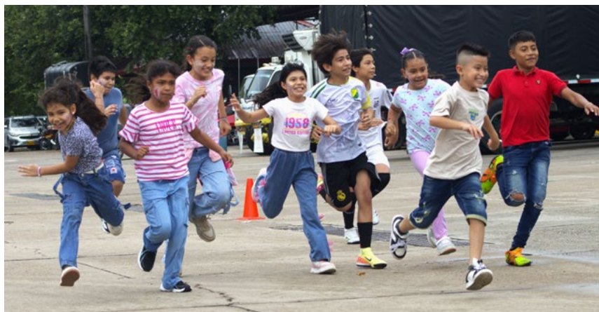
La carrera de atletismo puso a prueba el estado físico de los chicos

planeada. El gerente de Surabastos destacó que, durante los últimos cuatro años, la Cooperativa UTRAHUILCA es un aliado estratégico permanente debido a su experiencia en el manejo de públicos infantiles y su impecable capacidad organizativa.