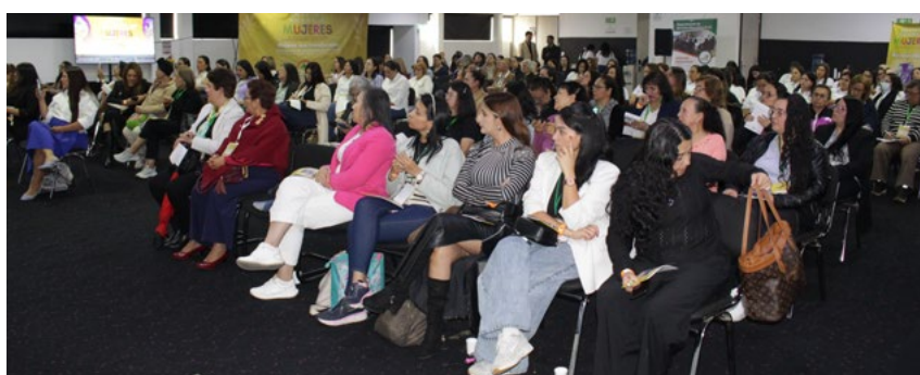
Participaron aproximadamente 200 mujeres en todo el evento.

Con esta nueva apuesta académica, la María Cano reafirma su compromiso con la educación de calidad y la formación de profesionales que aportan al bienestar, la salud y la transformación social del país.