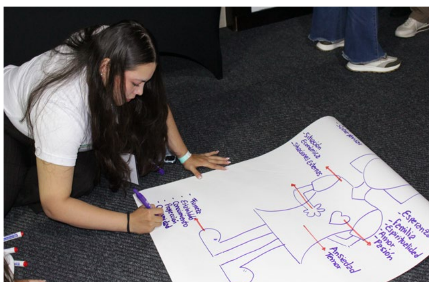
Talleres y mesas de trabajo, metodología que se usó para abordar diversos temas durante la jornada.