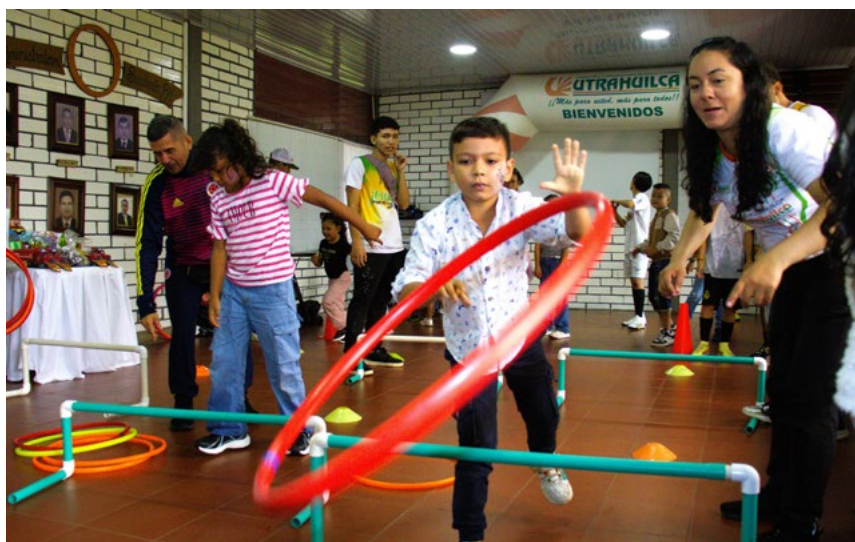
Niños y niñas disfrutaron de los juegos preparados para la jornada

a un auditorio. Allí, lo que pudo ser una decepción se convirtió en una explosión de alegrías.