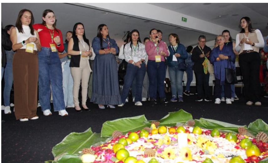
El encuentro culminó con un ejercicio de mandala en donde cada una conectaba con su ser.