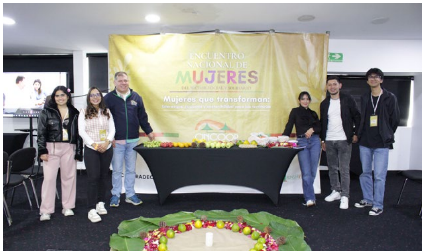
Equipo CINCOOP, quienes estuvieron detrás de esta experiencia.