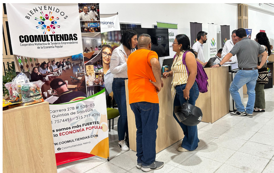
El propósito de la feria financiera fue que los pequeños y medianos emprendedores conocieran opciones de apalancamiento financiero para sus negocios.

La jornada contó con la participación de invitados de orden local y nacional, quienes aclararon dudas e inquietudes de los asistentes. UTRAHUILCA fue una de las distintas organizaciones presentes que expuso su portafolio de servicios.