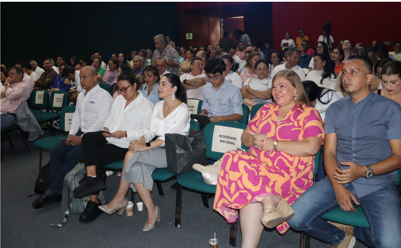
Gran presencia de las entidades del sector, quienes atentamente escucharon las experiencias de las diferentes organizaciones.

productores, comerciantes y tenderos para poder articular el rol gremial en el departamento del Huila encabezado por ASOCOOPH.