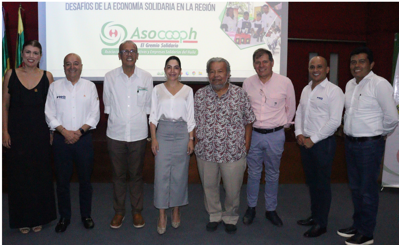
Algunos de los invitados nacionales que asistieron al evento.

"Podríamos decir que se mostró los impactos, los resultados de programas sociales, también de inclusión financiera y adicionalmente también todas aquellas organizaciones del sector agropecuario mostrando todos los convenios que vienen desarrollando y los beneficios que le vienen otorgando a sus asociados y a las comunidades en donde ellos actúan", recalzó el director ejecutivo.