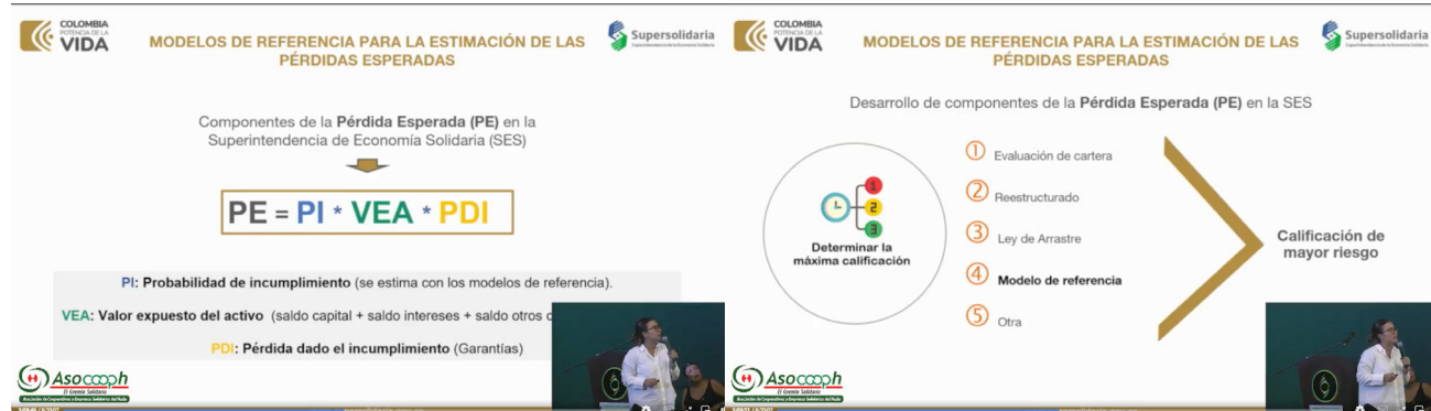
Componentes que integran la Pérdida Esperada en la Superintendencia de Economía Solidaria.

El encuentro también estableció compromisos por parte de entidades nacionales para facilitar herramientas y recursos disponibles para el desarrollo continuo de la política pública de economía solidaria. Esto subraya el reconocimiento a nivel gubernamental de la importancia de estas prácticas en el panorama económico nacional. Es importante que estas organizaciones nacionales de orden gubernamental, conozcan a las cooperativas y asociaciones de