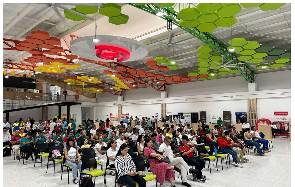
El evento contó con una masiva asistencia de público.