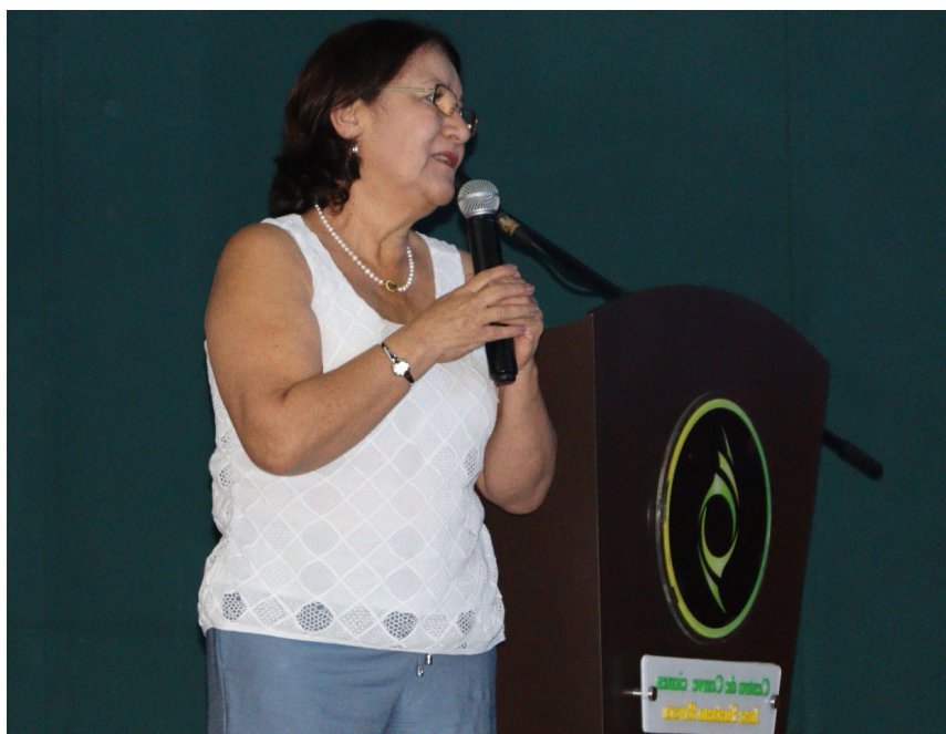
Adaptarse a los cambios, escuchar a la comunidad y aprender de los errores, ha sido lo que las organizaciones del Huila han hecho para seguir activas en los territorios.

La economía solidaria y el cooperativismo han emergido como fuerzas transformadoras en la región, abordando desafíos sociales y económicos con un enfoque en la colaboración, la inclusión y la sostenibilidad. A través de diversas temáticas como la inversión, la tecnificación rural y la innovación en la transformación de la materia prima, se ha evidenciado el papel crucial que desempeñan estas prácticas en el desarrollo regional.