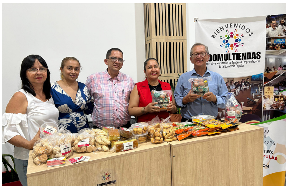
Coomultiendas es un proyecto huilense que reúne a los tenderos neivanos.

Sin duda, se dio un gran paso que reivindicó las luchas sociales de las comunidades. "Este fue el primer evento que se descentralizó desde Bogotá. Esto es un tema a replicar, tenemos mucha expectativa de que los puntos que salgan aquí muy favorables, sean para el beneficio de toda la comunidad, de todos los tenderos, de todos los emprendedores, y de toda la gente que haga parte de la economía popular", concluyó el gerente de Coomultiendas.