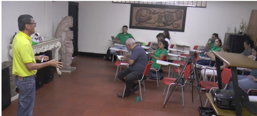
La economía política se convierte en una invitación a pensar y actuar de manera colectiva, solidaria y consciente.