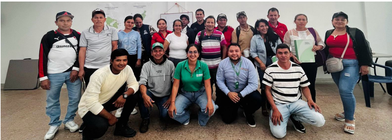
La casa solidaria sigue apoyando los procesos sociales, culturales y deportivos del municipio de Algeciras.

Culminado este taller, se espera avanzar en un diplomado de juntas de acción comunal, en el cual se pueda abarcar todos los cargos de la junta como presidente, secretario, y ahí se explique el trabajo de cada uno específicamente.