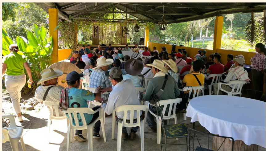
Capacitar a las comunidades permite desarrollar los territorios y generar mejores estilos de vida.

El gestor además destacó la manera en que se ha venido construyendo este ejercicio solidario: “es importante decir que no es un trabajo de ocho días, es un proceso que llevamos desde hace dos años, que