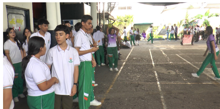
La inclusión social es uno de los pilares fuertes de FUNDAUTRAHUILCA junto al grupo de educación especial Yedaix.