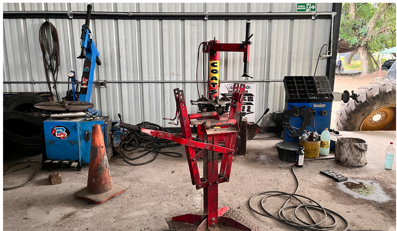
El negocio cuenta con los elementos necesarios para desarrollar su actividad.