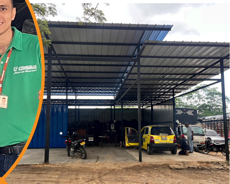
Hace poco, Vulcanizamos se trasladó a un espacio más amplio y cómodo.