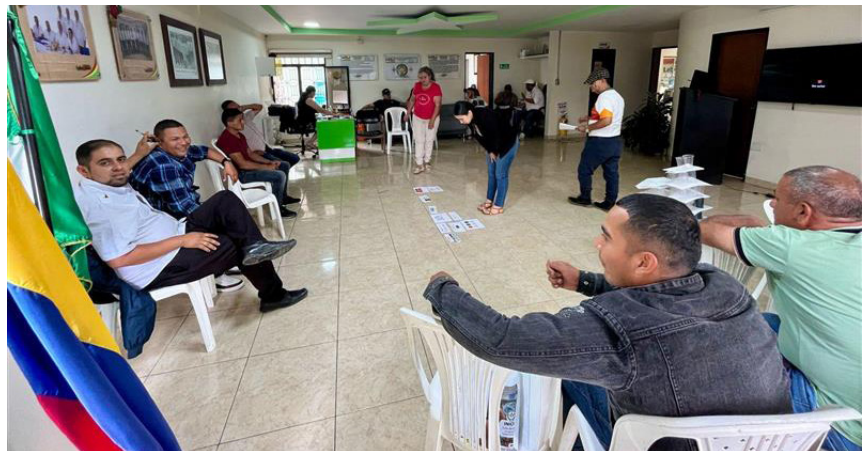
Ejercicios prácticos se incluyeron durante la capacitación.

Estas actividades refuerzan la labor de la Cooperativa en el desarrollo social y económico de la región, promoviendo la educación cooperativa y la inclusión financiera. UTRAHUILCA continúa consolidándose como un aliado estratégico para el bienestar de la comunidad.