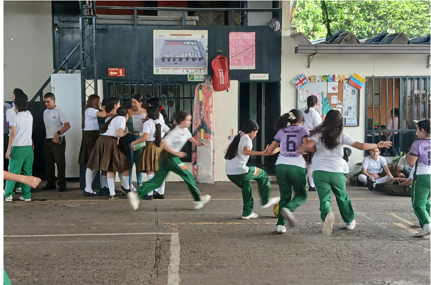
Los partidos se realizan los días lunes, miércoles y viernes para el torneo masculino y los días martes y jueves para el torneo femenino.