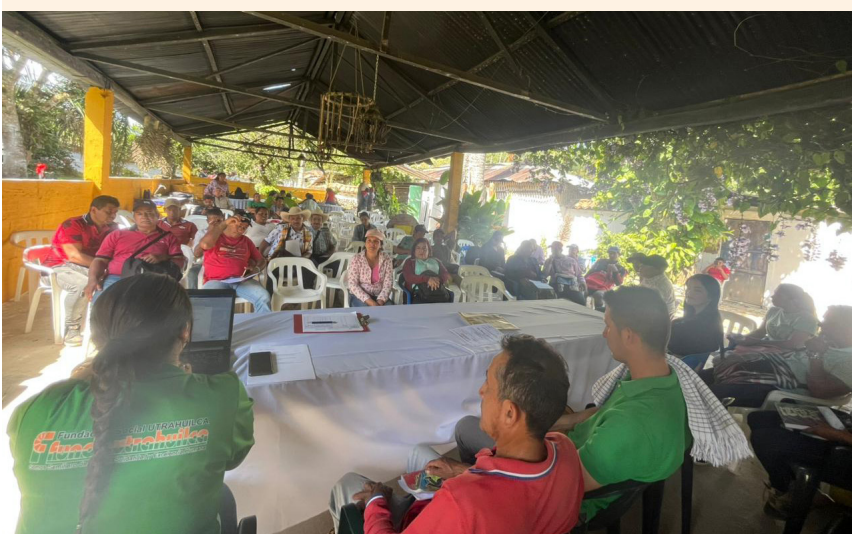
FUNDAUTRAHUILCA sigue trabajando de la mano con las comunidades rurales para fortalecer la economía local.

“Lo que viene es registrarla ante la cámara de comercio, como es cooperativa también va a la Supersolidaria para el reconocimiento y lógicamente seguir en ese proceso no solo de seguir vinculando personas sino de desarrollar un trabajo que permita que nuestros campesinos sientan que ha valido la pena conformar la cooperativa y que vamos a trabajar fuertemente en esa parte”, concluyó el Cuéllar Mora.