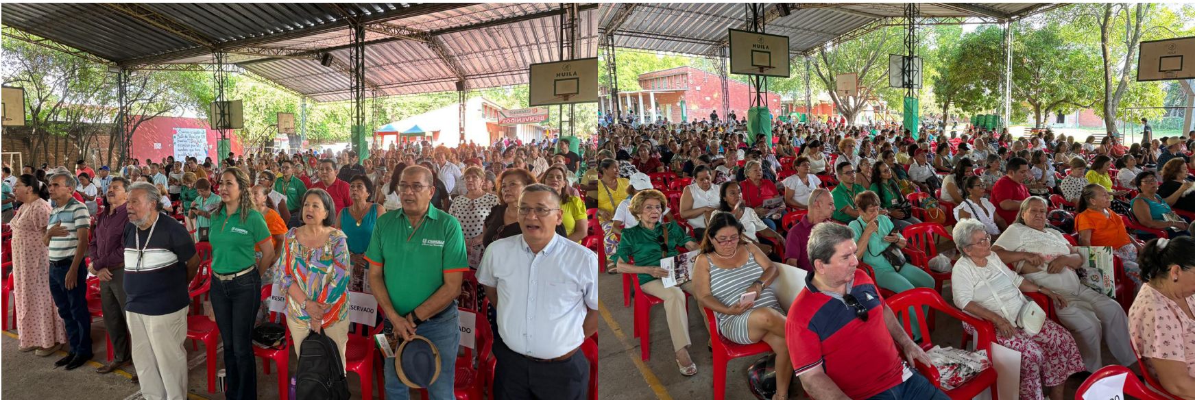
La oficina más grande de la entidad solidaria disfrutó de encuentro durante su Reunión Cooperativa realizada en las instalaciones de la Institución Educativa Liceo Santa Librada.