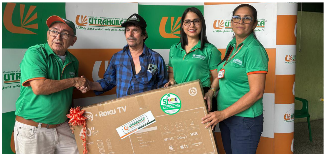
Asociados de la oficina UTRAHUILCA Neiva Mártires estuvieron muy animados durante la rifa y entrega de premios.

A pesar de las dificultades propias que trajo consigo el año 2024, UTRAHUILCA logró importantes resultados económicos y sociales que beneficiaron a más de doscientos cuarenta mil asociados en toda la región Surcolombiana. Excedentes que garantizarán a la cooperativa mantener beneficios e impacto a la comunidad en el nuevo año.