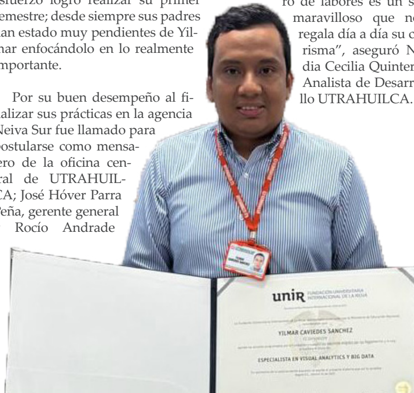
Orgullosos con su título de Especialista en Visual Analytics y Big Data de la Universidad Internacional de la Rioja- UNIR.