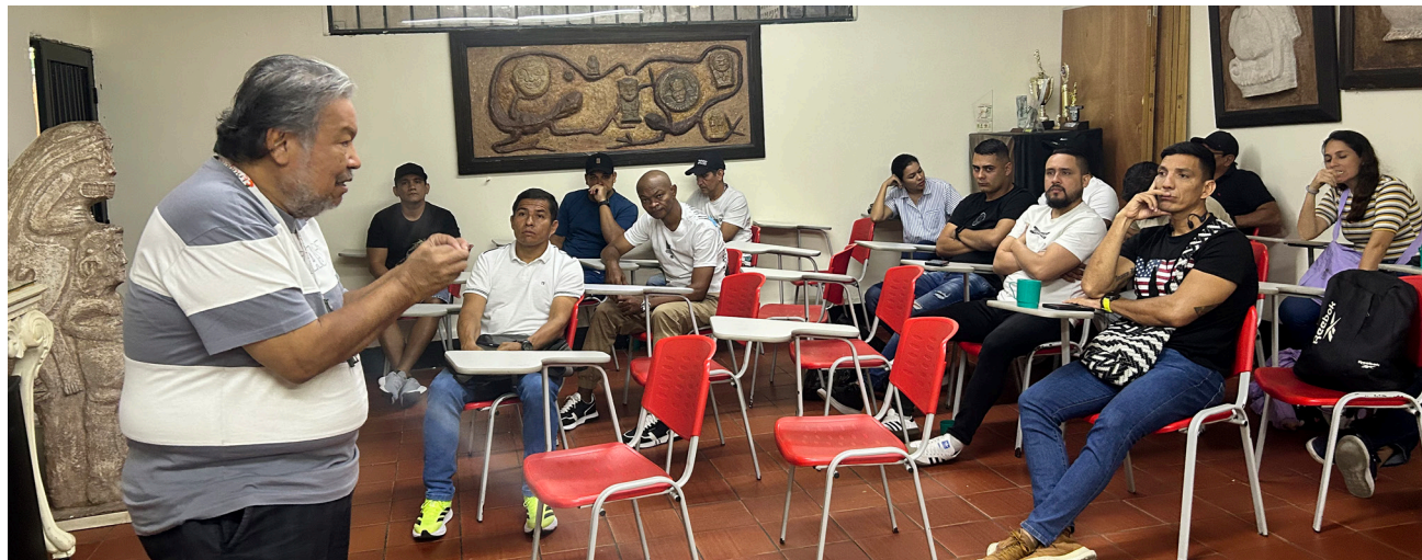
El deporte es más que competencia, fue el tema central del encuentro de entrenadores de FUNDAUTRAHUILCA en el 2025.

Este espacio permitió reflexionar sobre el trabajo que se viene realizando con los deportistas en todas las disciplinas, marcando una línea diferencial basada en la