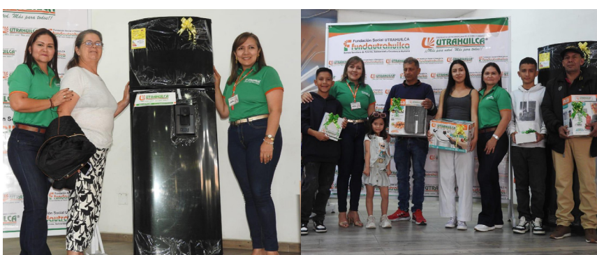
El sur del departamento del Huila también se unió a estos encuentros. Pitalito acompañó a UTRAHUILCA en sus reuniones cooperativas.

Cada encuentro permitió no solo conocer el balance social y económico de la cooperativa UTRAHUILCA, sino también la participación en sorteo de fabulosos premios y la muestra cultural por parte de FUNDAUTRAHUILCA.