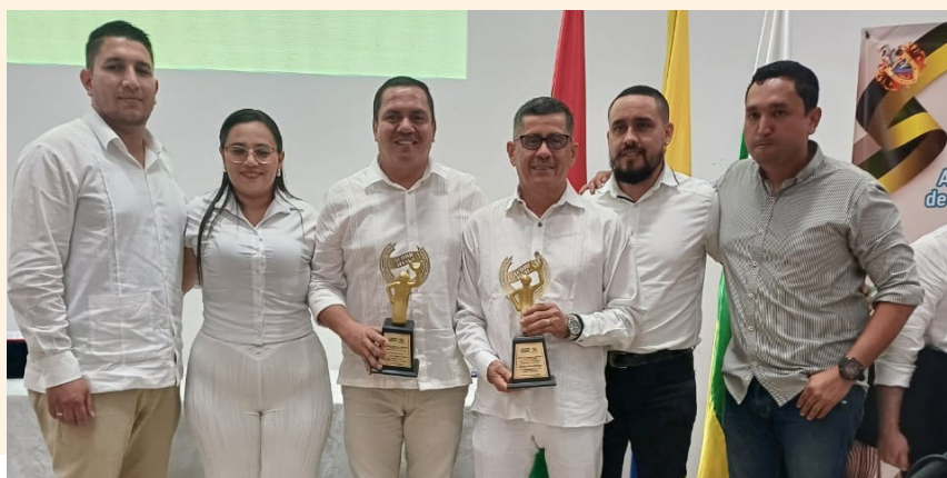
El club deportivo Guagua de UTRAHUILCA en Palermo fue reconocido como el mejor club de la región.