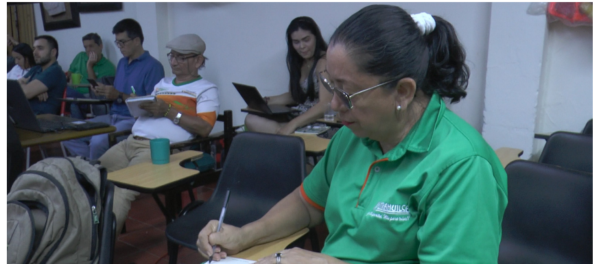
Aprender de la historia es la herramienta más poderosa para enfrentar la desigualdad y construir una sociedad más justa.

Además, advirtió que el mayor peligro para las cooperativas y las organizaciones sociales es el avance del neoliberalismo, que busca dejar todo al libre mercado, poniendo en desventaja a las comunidades