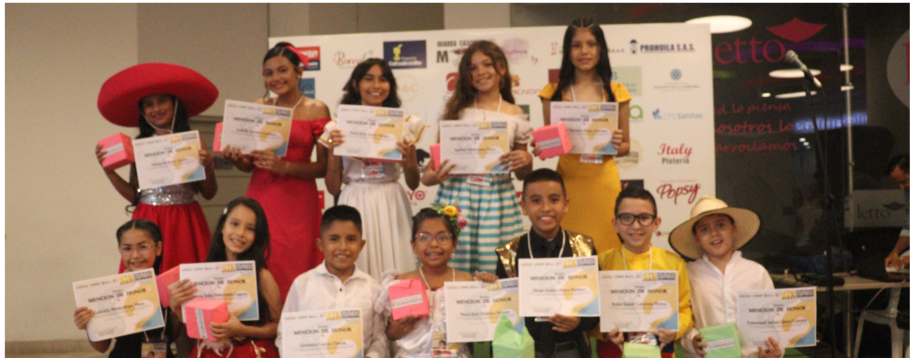
Participantes del último festival.

Su legado sigue vivo en cada niño que sube al escenario y en cada nota que resuena en este festival,