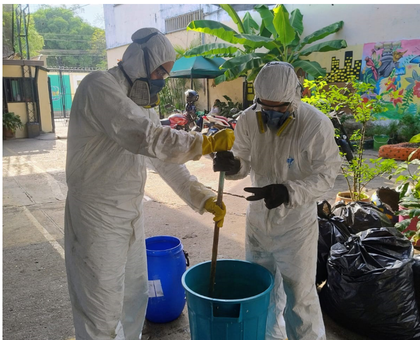
El propósito del colegio UTRAHUILCA es llegar a más territorios mostrando su proyecto ambiental.