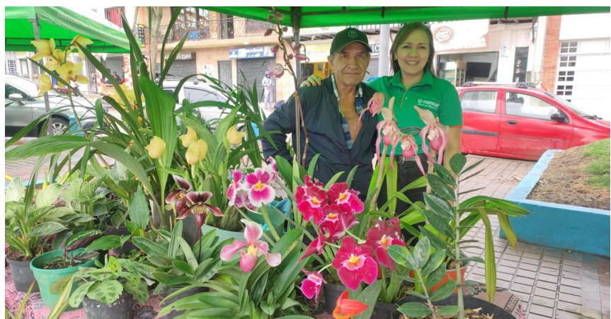
Siempre hay una sonrisa para nuestra base social.