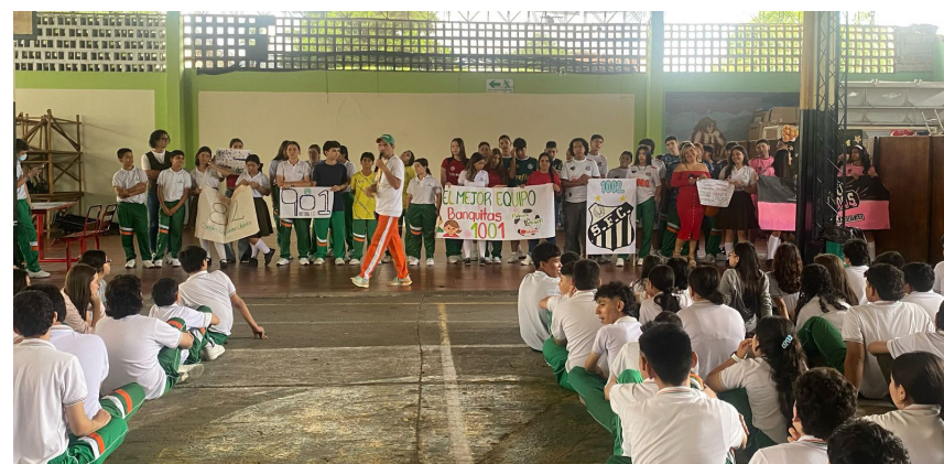
El objetivo principal de los Inter curso es incentivar a los estudiantes a la práctica de un deporte y de la buena utilización del tiempo libre.

Al cierre de esta edición se adelantaba el cuadrangular final femenino entre los grados décimo y undécimo, y las finales tanto masculino y femenino se tenían previstas para la última semana de marzo.