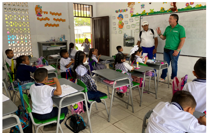
Niños y niñas escucharon atentos la invitación de UTRAHUILCA.

La invitación sigue abierta para que más familias y emprendedores se sumen a esta gran comunidad solidaria y descubran todas las ventajas de hacer parte de UTRAHUILCA.