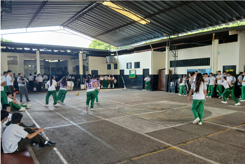
Las competencias utrahuilqueñas empezaron con el torneo de banquitas tanto masculino como femenino.