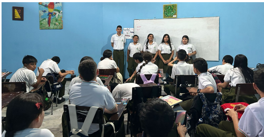
Elección de representantes y constructores de paz.

2. Constructores de Paz - mediadores para una mejor convivencia: El rol de los constructores de paz es esencial dentro del colegio, ya que su función es prevenir y resolver conflictos de manera pacífica. Su presencia ayuda a fortalecer el diálogo, el respeto y la tolerancia entre los estudiantes. Son capacitados para identificar problemas dentro del entorno escolar y proponer soluciones que contribuyan a una convivencia armónica.