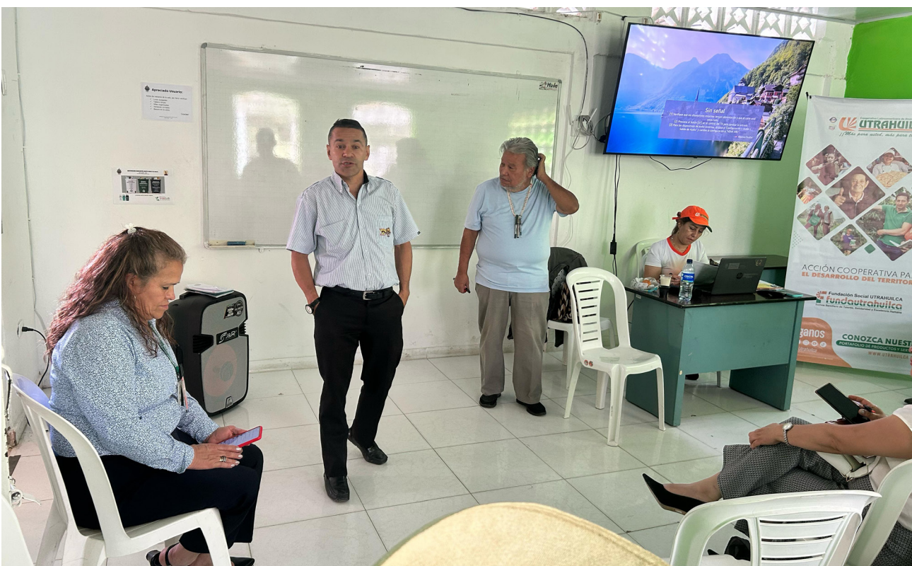
Los presentes expresaron sus agradecimientos a UTRAHUILCA y FUNDAUTRAHUILCA por la jornada.

Estas acciones consolidan el papel de UTRAHUILCA y FUNDAUTRAHUILCA como aliados estratégicos en el progreso de Santa María, demostrando que el trabajo cooperativo es una herramienta poderosa para la transformación social y económica del territorio.