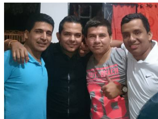
Junto a sus amigos.