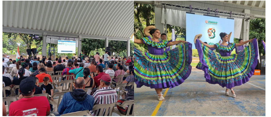
Muy atentos estuvieron los garzoneños de la muestra cultural de FUNDAUTRAHUILCA.