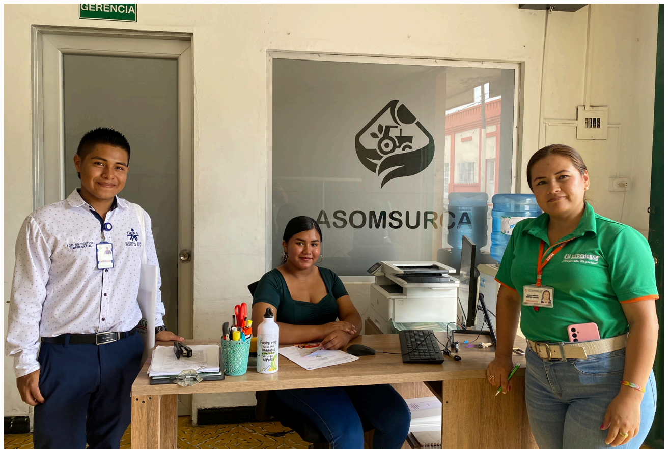
Las visitas a los negocios fortalecen los vínculos comerciales con este sector.

Durante las visitas, se resolvieron inquietudes sobre los trámites y requisitos para convertirse en asociado de UTRAHUILCA, así como sobre las condiciones de los créditos. Se destacó que la organización