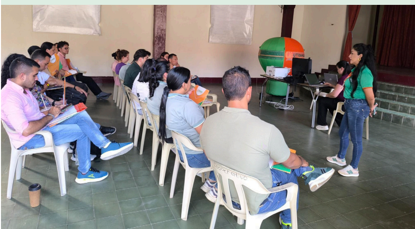
La jornada se desarrolló en el Colegio Cooperativo del municipio.

UTRAHUILCA sigue afianzando su compromiso con los asociados del convenio empresarial, garantizando soluciones financieras y consolidando una relación de confianza.