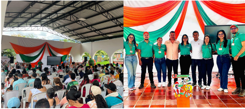
La localidad de Algeciras asistió masivamente al encuentro utrahuilqueño.