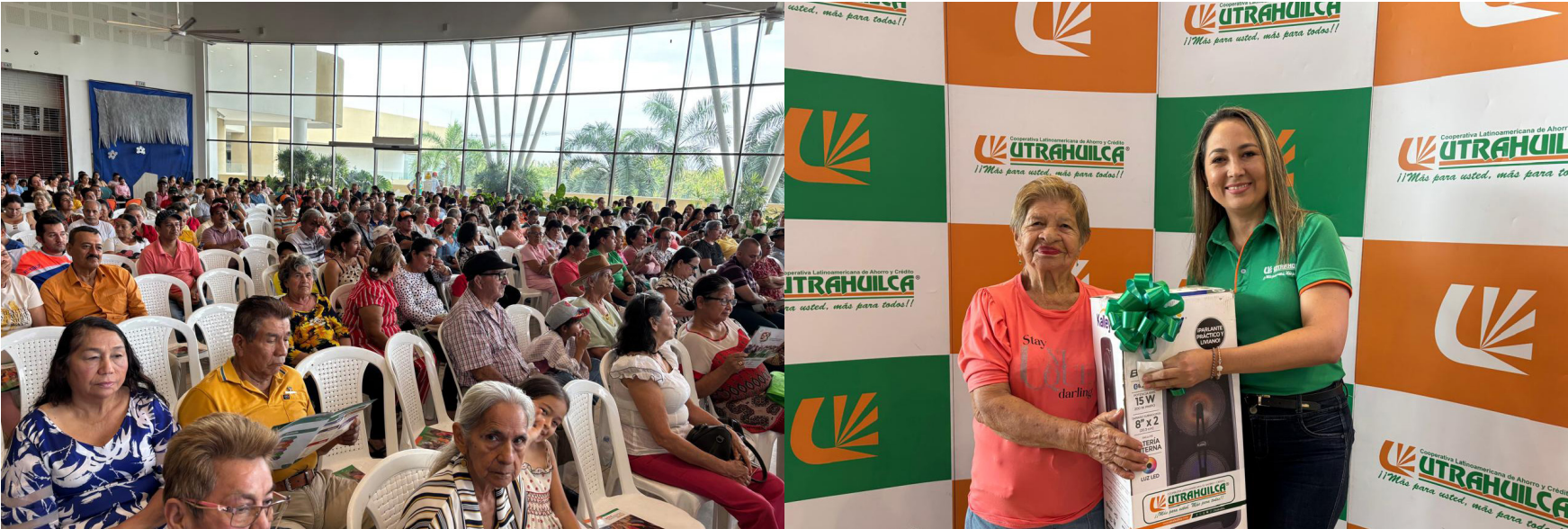
UTRAHUILCA Neiva Sur le cumplió a sus asociados con la entrega de fabulosos premios.