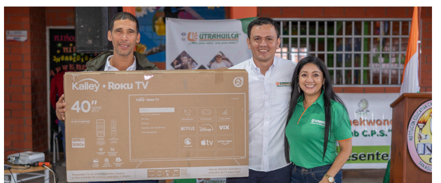
Lo mismo ocurrió en el municipio de San Agustín, quienes disfrutaron de muestras artísticas y culturales.