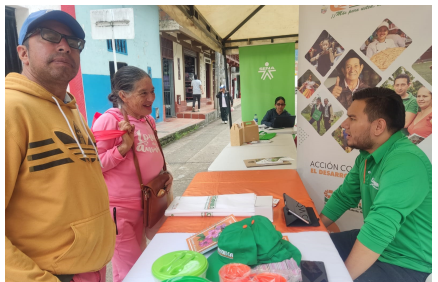
Se les brindó información a las personas que visitaron el stand tricolor.