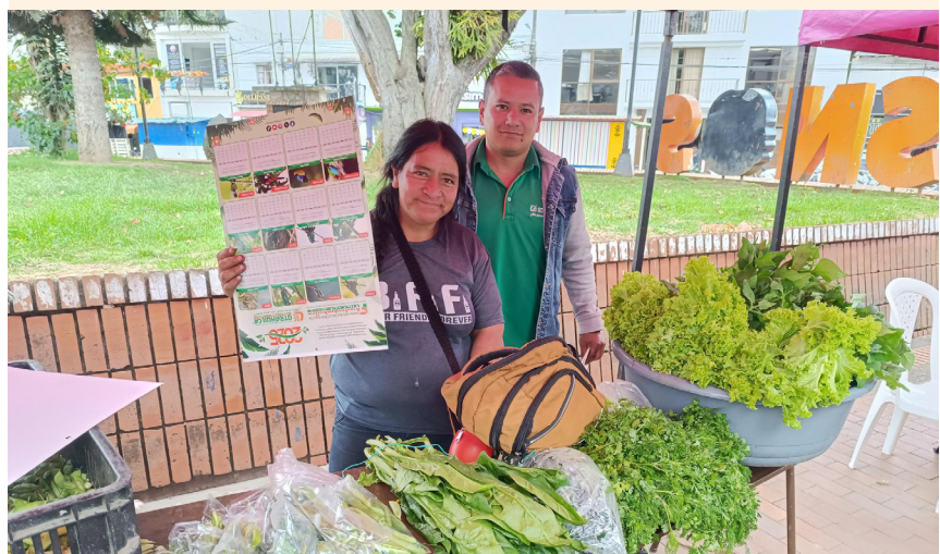
Hubo detalles utrahuilqueños para los campesinos.