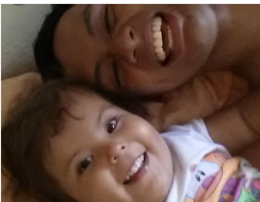
El amor por sus sobrinas lo hacen inmensamente feliz.