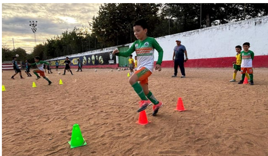
Todos los martes y jueves la cita en la cancha del barrio Las Granjas.

Al igual que en Neiva en los diferentes municipios de la región Surcolombiana donde la cooperativa UTRAHUILCA hace presencia se tiene el desarrollo de las diferentes escuelas de formación deportivas y artísticas, las inscripciones están abiertas para todos los interesados en vincular a los niños en el segundo semestre del 2026, mayor información en las agencias de la entidad solidaria y en la capital del Huila en la sede administrativa de FUNDAUTRAHUILCA