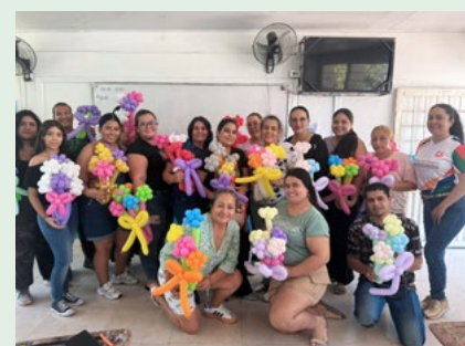
Felices se han mostrado los y las participantes del curso