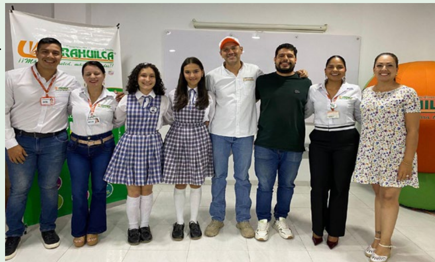
En la zona centro participaron los municipios de Garzón, Gigante y Acevedo.

Tras la evaluación de los jurados, la Institución Educativa Simón Bolívar de Garzón obtuvo el mejor puntaje y será la encargada de representar a la región centro en la final.