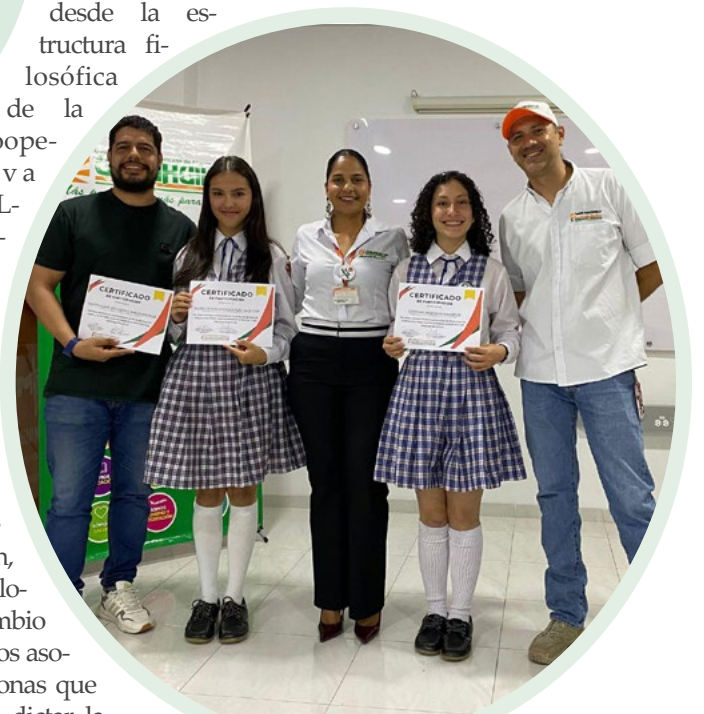
Los espacios de formación de la casa solidaria son clave para nuestros asociados

Al dotar a los asociados de estas herramientas de conocimiento, la Fundación busca que la apropiación del sector no sea solo una etiqueta, sino una práctica cotidiana. Así, UTRAHUILCA deja clara su tarea de consolidar una base social consciente, preparada para liderar procesos que trasciendan la simple prestación de servicios y se conviertan en motores de desarrollo para el departamento.