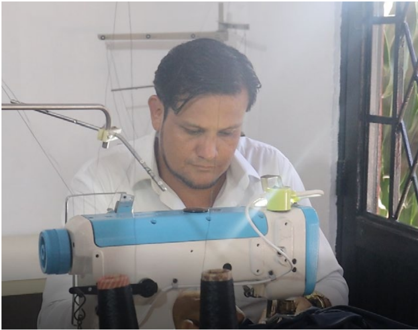
Sueño que se convirtió en un emprendimiento familiar.