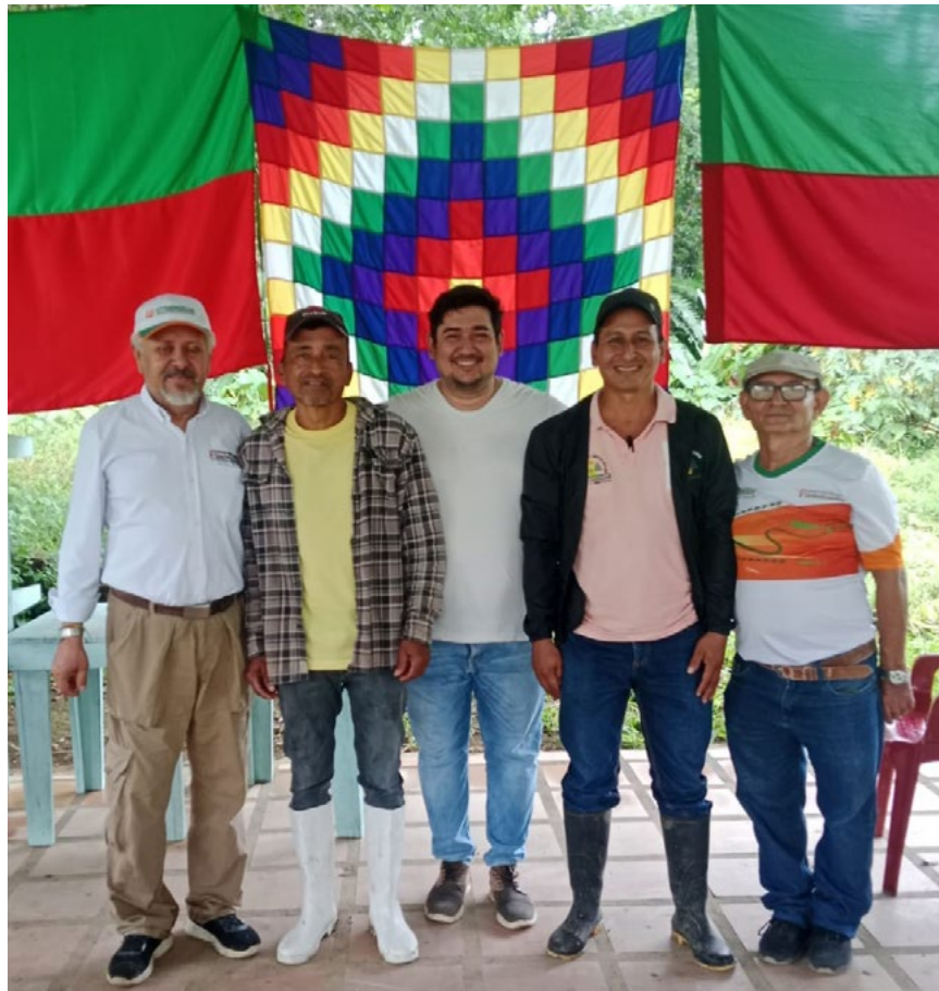
En el curso participaron 59 veredas y 4 cabildos.

el papel de cada uno de los asociados, como parte o no de los diferentes organismos de administración, control y vigilancia.