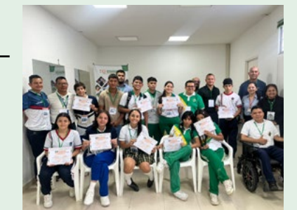
La Institución Educativa Dante Alighieri de San Vicente del Caguán, representará a la zona Caquetá.

Tras las deliberaciones, la Institución Educativa Dante Alighieri de San Vicente del Caguán quedó seleccionada para representar al departamento en la fase final.