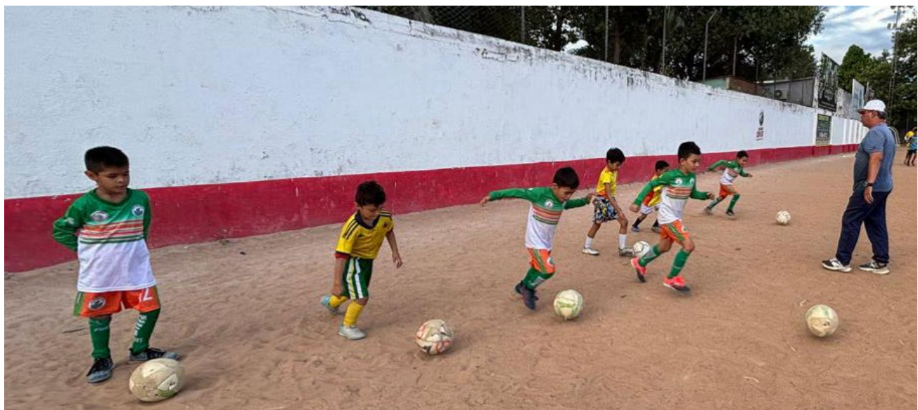
El acompañamiento de los padres de familia es fundamental en el proceso de los niños.