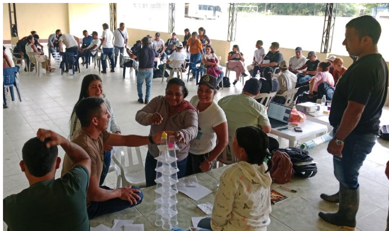
A través de ejercicios prácticos los y las asistentes aprendieron sobre cooperativismo