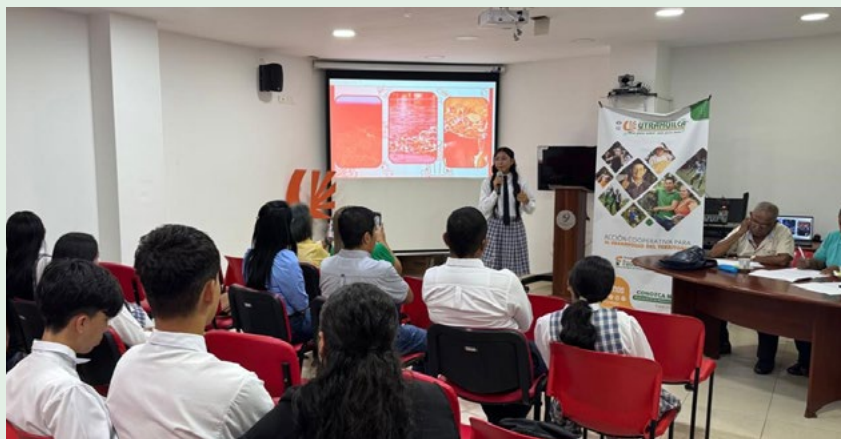
La Institución Educativa Villa de los Andes, representará al occidente del Huila.