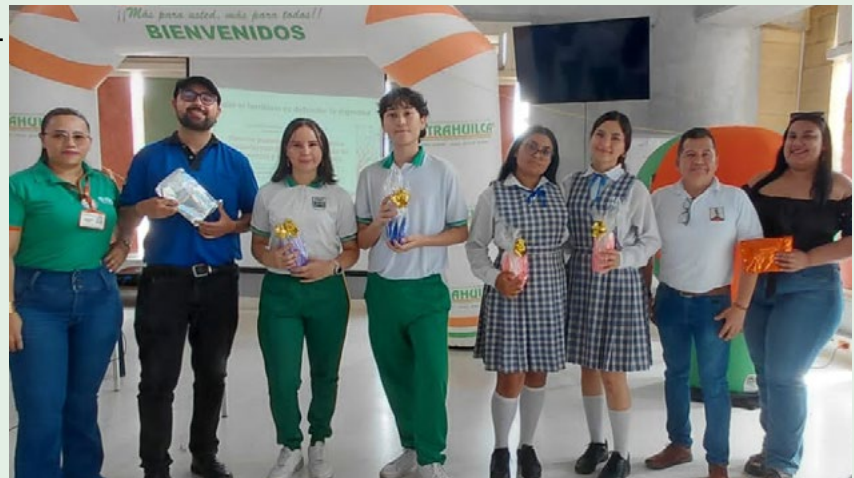
Eliminatoria zona noroccidente.

Luego de las presentaciones y la evaluación correspondiente, la Institución Educativa San Juan Bosco obtuvo el primer lugar y se convirtió en la representante oficial de esta zona en la gran final de Neiva.