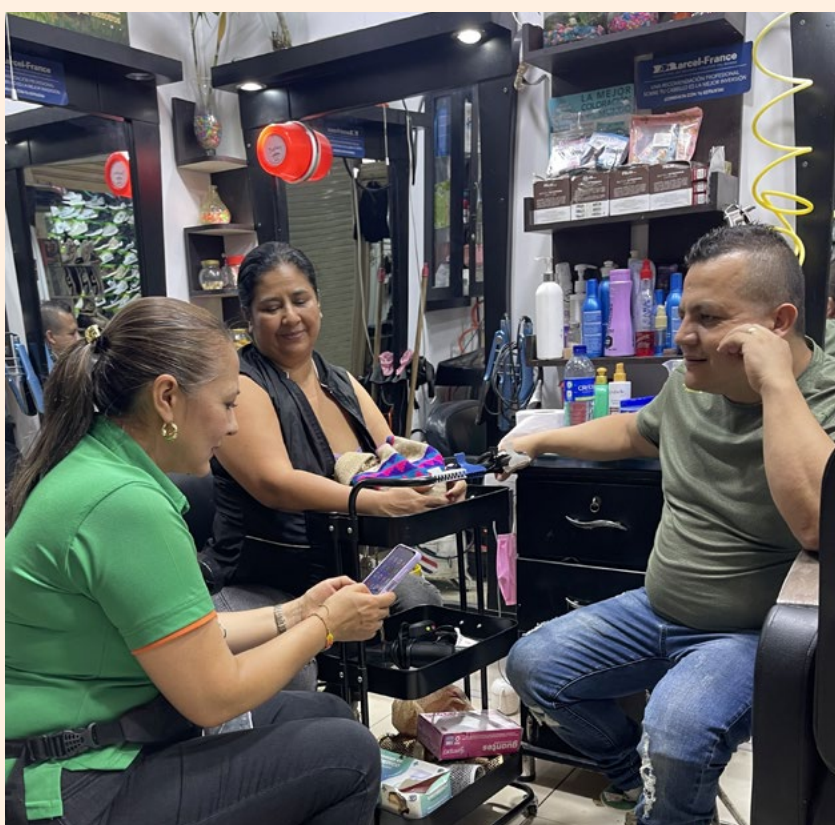
El diálogo siempre será nuestro mayor tesoro para conocer la necesidades de nuestros asociados

De igual forma, UTRAHUILCA participó en la Feria de Crédito organizada por UNIMINUTO en la Institución Educativa Montessori, un espacio dirigido a estudiantes interesados en conocer opciones para financiar sus estudios. Allí se socializó la línea de crédito educativo y los beneficios que reciben quienes hacen parte de la cooperativa, entre ellos descuentos en matrícula y pensiones en instituciones aliadas.