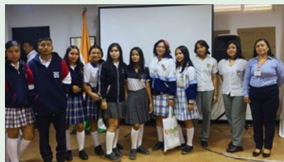
53 personas participaron, entre público y ponentes, en la eliminatoria en el Cauca.

La eliminatoria zonal se realizó en el auditorio de la agencia UTRAHUILCA en Popayán. Allí, tres jurados especializados evaluaron las propuestas presentadas para seleccionar la representación que viajará a Neiva.