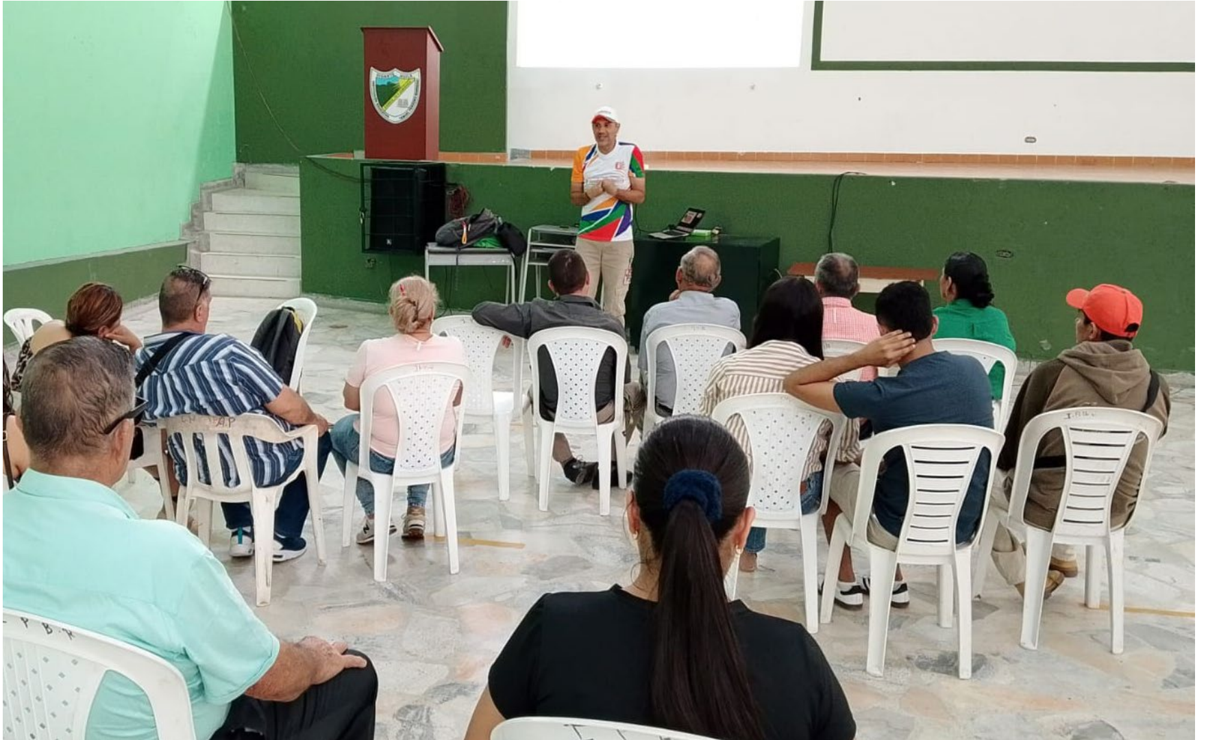
Adultos y jóvenes tienen las puertas abiertas para participar en cursos de formación