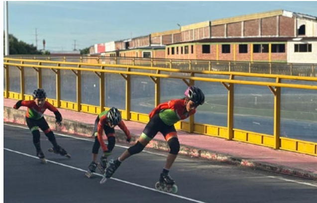
Humedad, deterioro de la pista, camerinos y duchas no disponible al acceso de los deportistas, hace parte de la situación en el Patinódromo de Neiva.