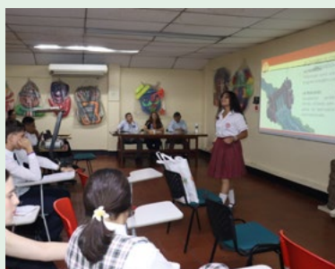
Zona Neiva, el encuentro se llevó a cabo en el Colegio Cooperativo UTRAHUILCA.