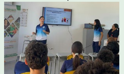
En el Tolima también se realizó este ejercicio de participación estudiantil.

Además de la exposición académica, se promovieron conversaciones sobre ahorro, cooperativismo y responsabilidad social, generando una experiencia formativa integral para los asistentes.