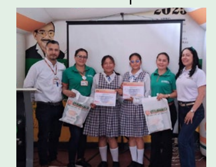
Eliminatoria del norte del Huila en el municipio de Campoalegre.

Su propuesta destacó por el análisis crítico de los impactos globales sobre las comunidades locales y por plantear estrategias de participación juvenil para la defensa del territorio.