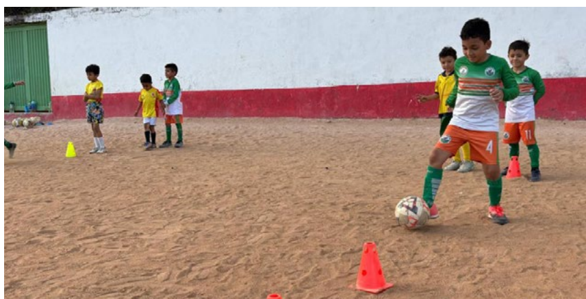
UTRAHUILCA semillero de nuevos talentos en el deporte.