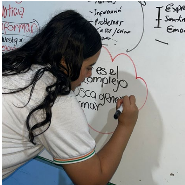
Diferentes habilidades lograr los estudiantes que integran este proceso comunicativo.

Gracias a estos espacios de formación comunicativa los estudiantes ultrahuilqueños que han hecho parte de esta lúdica, han tenido la oportunidad de explorar como presentadores del programa institucional Dimensión Cooperativa, así como también cumplir diferentes roles como el presentar o ser reporteros de eventos organizados