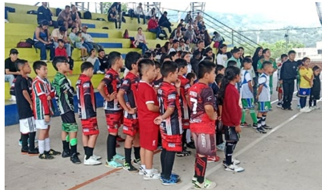
Balance positivo en participación del intercambio deportivo del sur del Huila.