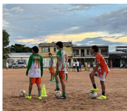
Deportistas de UTRAHUILCA de los municipios de Baraya, Algeciras, La Plata, así como Neiva integran el equipo que hoy es fuerte y se destaca dentro del torneo.