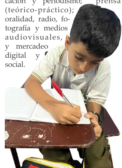
Estudiantes destacados no solo desde periodismo sino también desde otras lúdicas artísticas y deportivas.

El área de comunicaciones diseñó de manera didáctica con temáticas específicas los módulos que se han venido desarrollando desde el año anterior que componen el curso o ciclo formativo dentro de la lúdica de periodismo y comunicación comunitaria, con el fin de tener organizados los temas aplicados para cada grupo; en el marco de estos módulos se encuentran: comunicación y periodismo; prensa (teórico-práctico); oralidad, radio, fotografía y medios audiovisuales, y mercadeo digital y social.