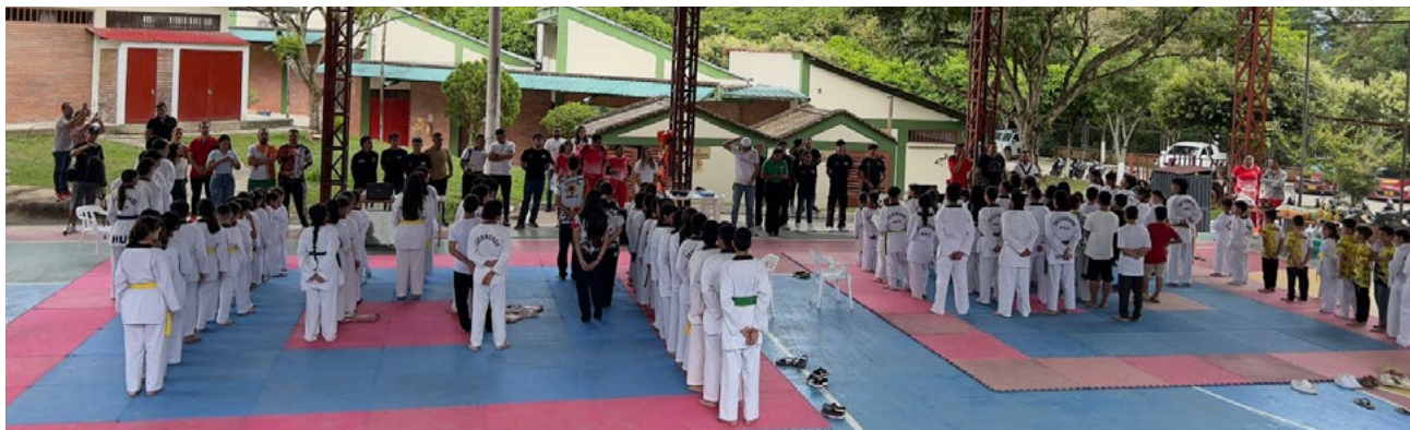
En las instalaciones de la Universidad Surcolombiana se realizó el evento.