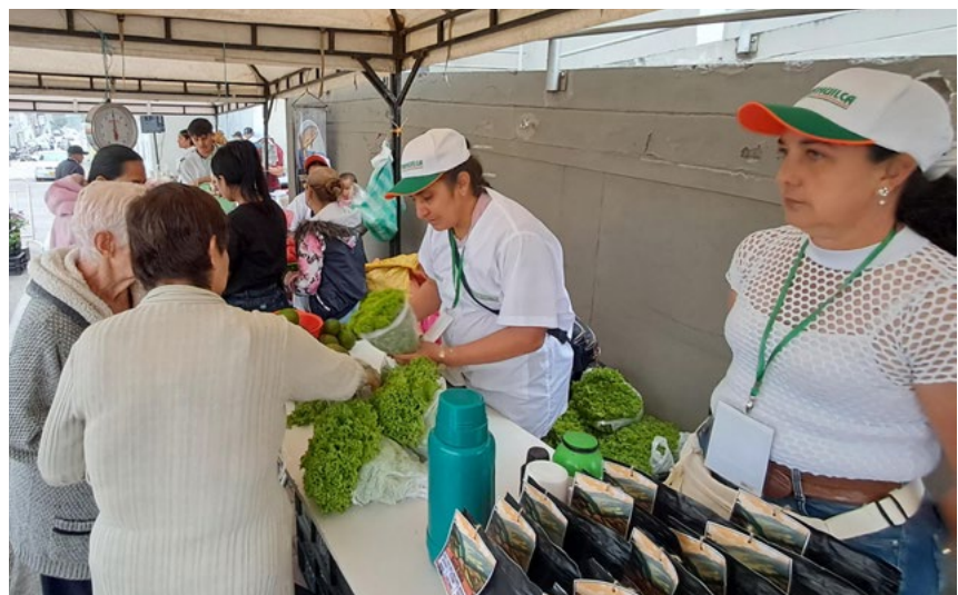
Masivo fue el número de compradores en el mercado campesino

Por: Redacción Agencia UTRAHUILCA Pitalito