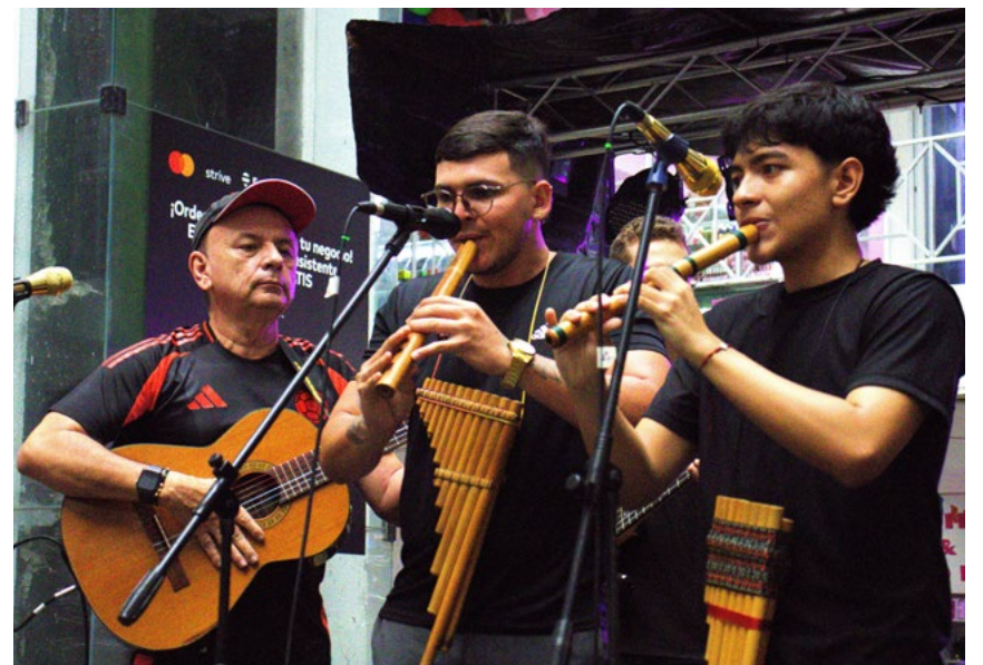
El talento musical de Palermo amenizó una parte de la jornada