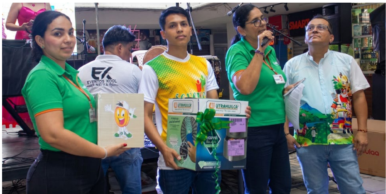
UTRAHUILCA se vinculó con la entrega de obsequios