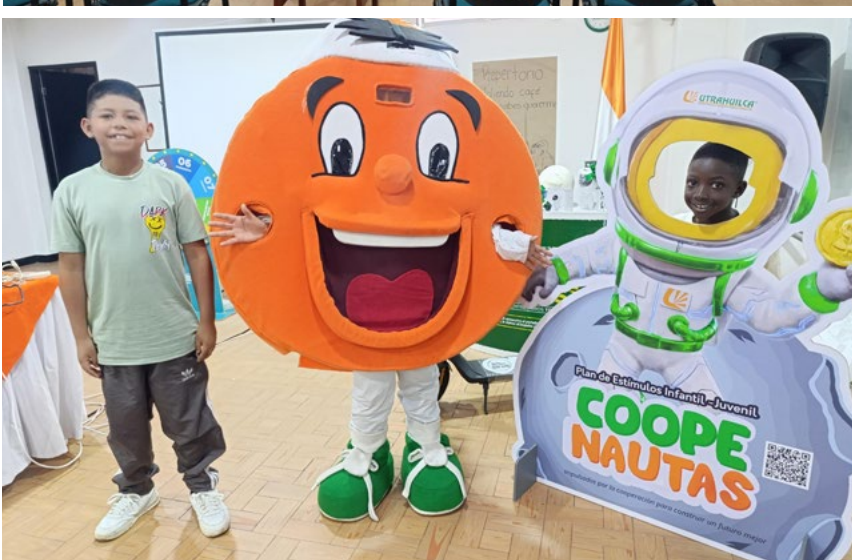
Incentivar a los niños hacia el ahorro es la esencia de la entidad solidaria. En la foto los niños de la agencia UTRAHUILCA Popayán.