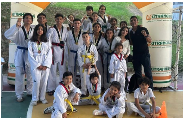
Más de 150 deportistas participaron del encuentro liderado por FUNDAUTRAHUILCA.