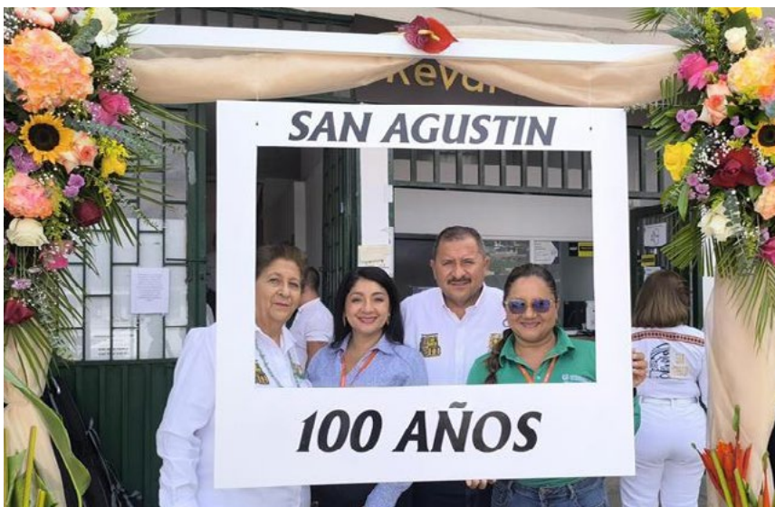
¡Felices 100 años, San Agustín!

El trabajo comunitario de UTRAHUILCA es un testimonio de que la solidaridad es una tarea diaria, una que se ensaya en la oficina, se vive en la calle y se celebra en cada sonrisa recuperada.