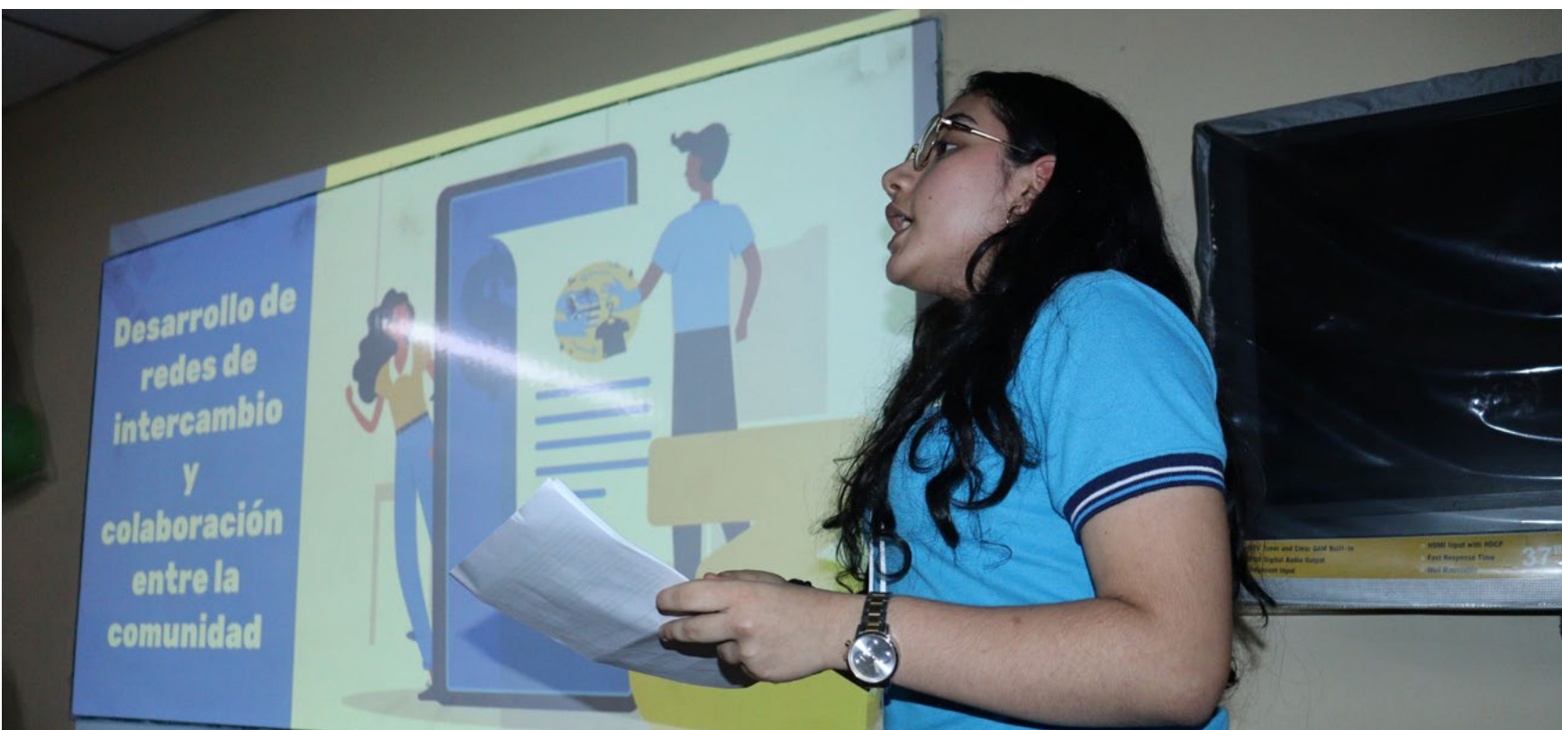
Las voces de los jóvenes, más que participación es conocer sus territorios.