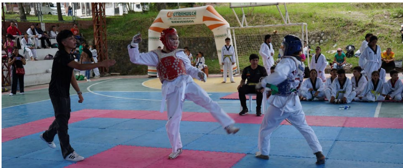
En Garzón se cumplió el encuentro.

La jornada que inició pasada las ocho de la mañana tuvo la realización del Festival Infantil con la exhibición de poomsaes y combates en categorías iniciación y avanzados, así como también la vinculación de dos clubes invitados de Garzón como municipio anfitrión, "fue todo un éxito ya que era el Primer Campeonato Departamental Interno de FUNDAUTRAHUILCA para este año, al final de la jornada los