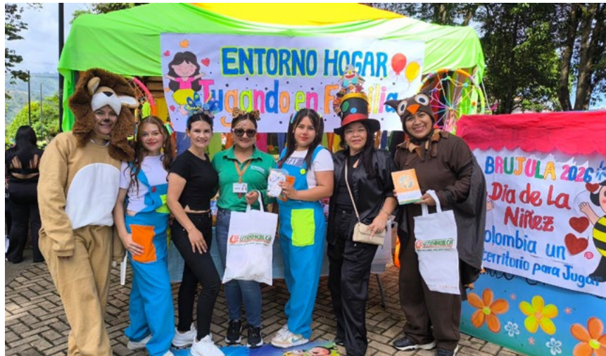
Felicidad es lo que se observa en cada actividad

El espíritu de apoyo se trasladó a los encuentros con Funcamino, un