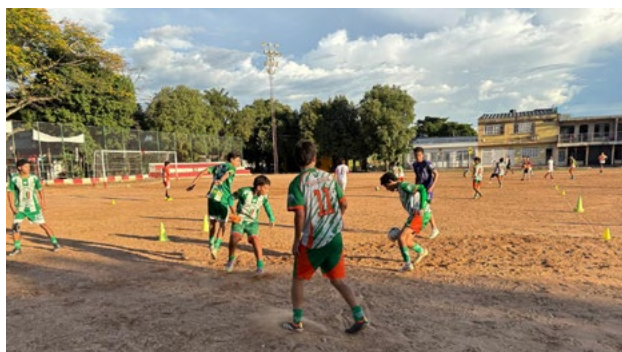
Trabajo táctico, pero sobretodo de formación integral de los jugadores hace parte de los objetivos trazados por su entrenador.

Así mismo expresó que este torneo de liga que inició en el mes de marzo se tendrá prácticamente durante todo el año en partidos