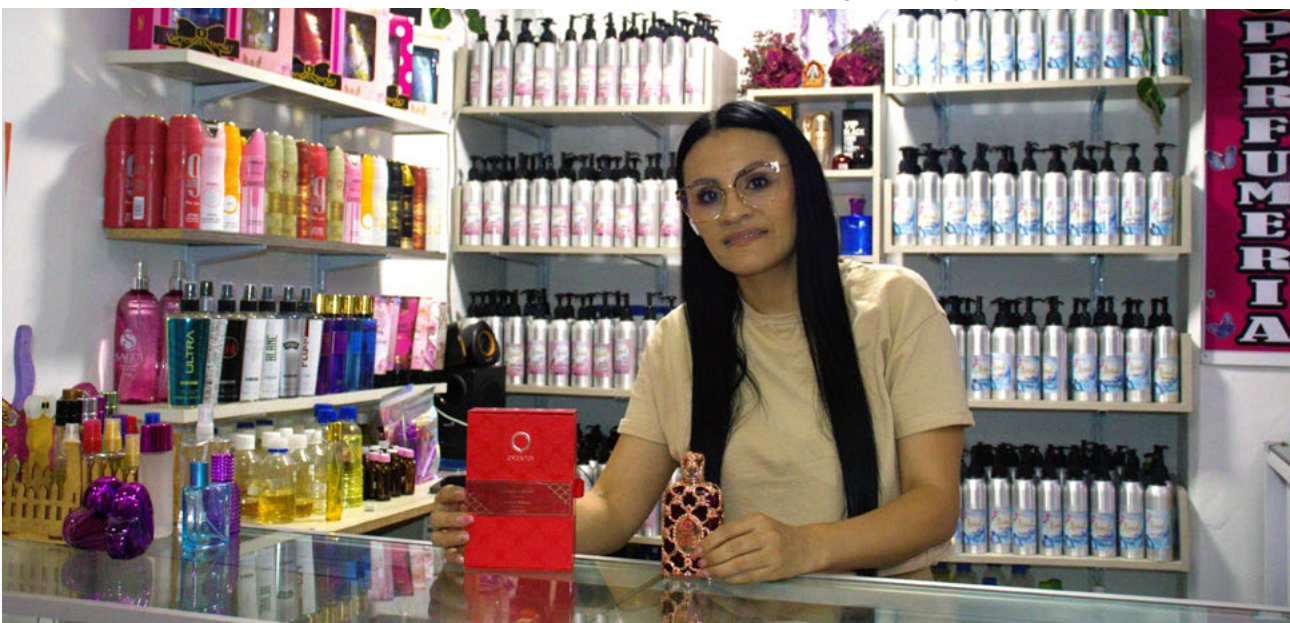
La actividad fue oportuna para la ventas de los pequeños y medianos emprendedores