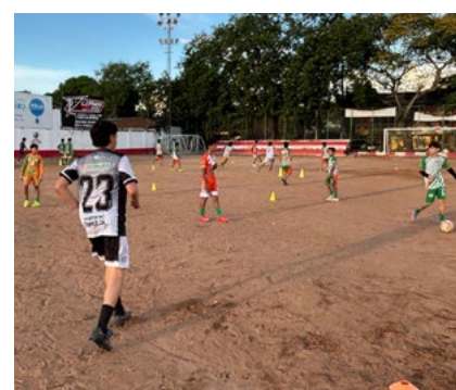
Un gran semillero de nuevos talentos en el fútbol es lo que se evidencia en los entrenamientos.