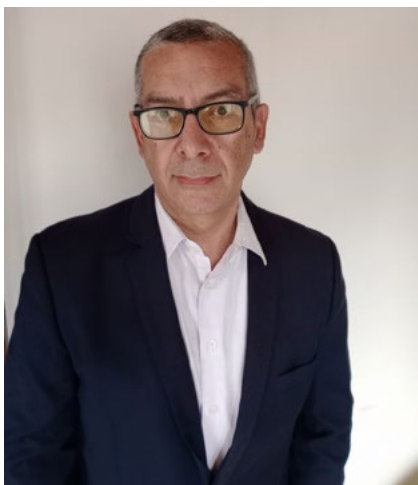
Por: Alfredo Alzate Escolar Director Revista Gestión Solidaria

El cierre del estrecho de Ormuz abre una esperanza para los cultivadores del mundo. Que sus costos de producción se reduzcan, así