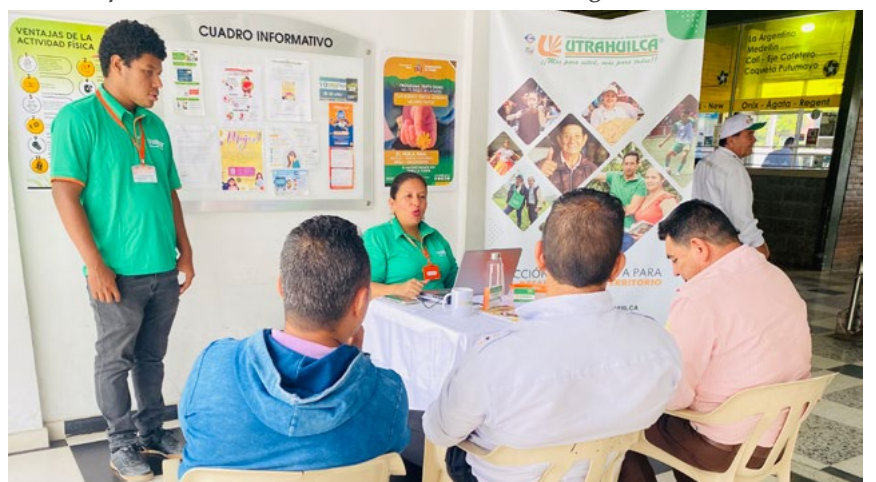
La oficina móvil acerca los servicios de UTRAHUILCA a la comunidad