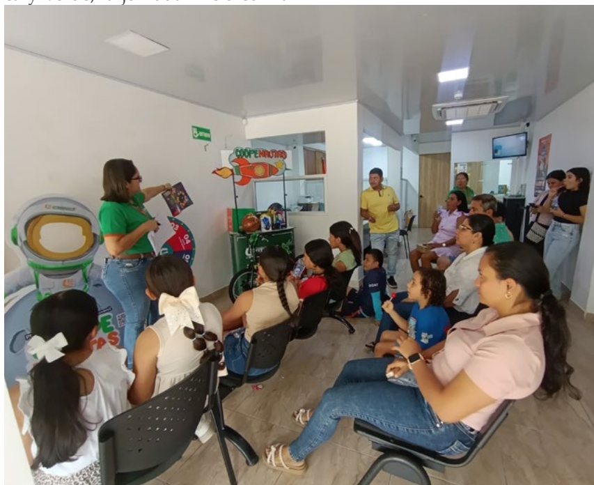
Muy alegres estuvieron los participantes de la jornada liderada por la entidad solidaria.