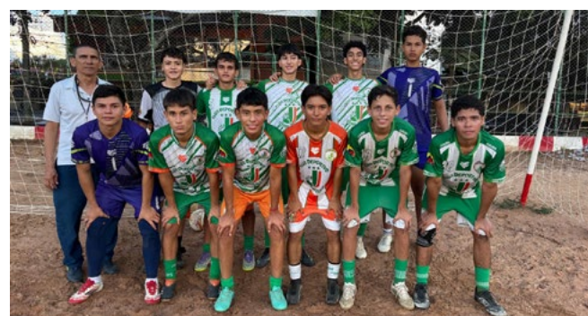
El sueño del equipo utrahuilqueño es lograr el título de campeones, para ello trabajan fuertemente en este objetivo.