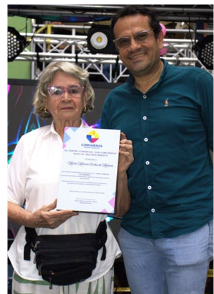
Se entregaron reconocimientos a quienes llevan más de 20 años con su negocio dentro de Los Comunerios