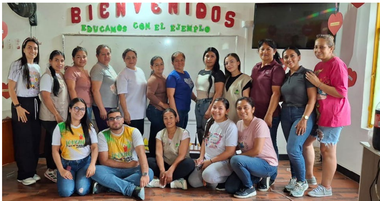
Positivo resultó el taller

Al final del día, estas acciones demuestran que el modelo de UTRAHUILCA en La Plata es un ciclo constante de respaldo. Desde la seguridad que brinda una alianza financiera hasta la luz que aporta una formación pedagógica, la Cooperativa sigue demostrando que la solidaridad es, sin duda, el motor que impulsa el desarrollo integral de nuestro territorio.