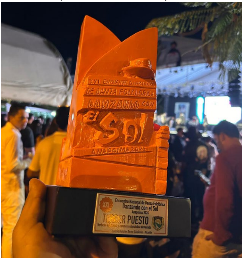
Un tercer lugar que refleja el trabajo del talento fundautrahuilqueño

La preparación para las próximas giras principió en el salón de la agencia de la Cooperativa UTRAHUILCA. Es difícil descanso para quienes cargan con la responsabilidad de ser la imagen de la economía solidaria y el arte regional. Con la mirada puesta en nuevas invitaciones y el corazón anclado en sus raíces, la Escuela de Danzas Tukuikuna sigue puliendo la técnica y el sentimiento, convencida de que el próximo escenario será, sin duda, otra ventana abierta hacia el mundo.