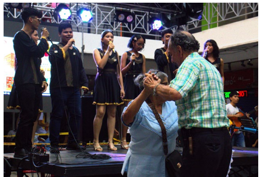
¡Qué ambiente! Hasta los asistentes se animaron a bailar