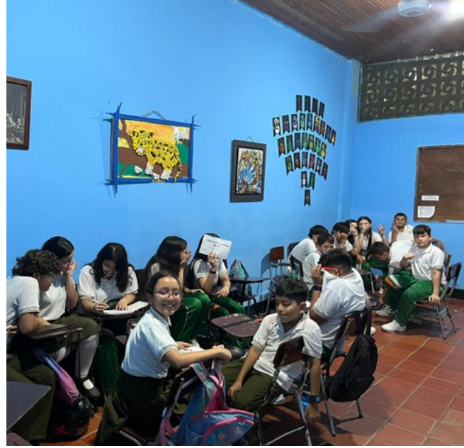
Los niños en su proceso de iniciación, también son protagonistas y referentes en el trabajo social.