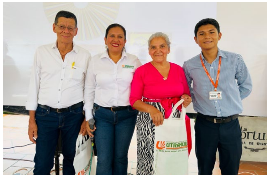
Detalles para la base social de nuestros aliados estratégicos

Además, se formalizaron libranzas de aportes y se abrieron programas de ahorro, demostrando que cuando la institución se acerca a las personas, la respuesta es siempre positiva y llena de confianza.