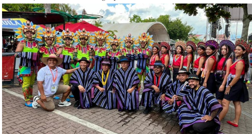
Delegación de la escuela que viajó a Anapoima