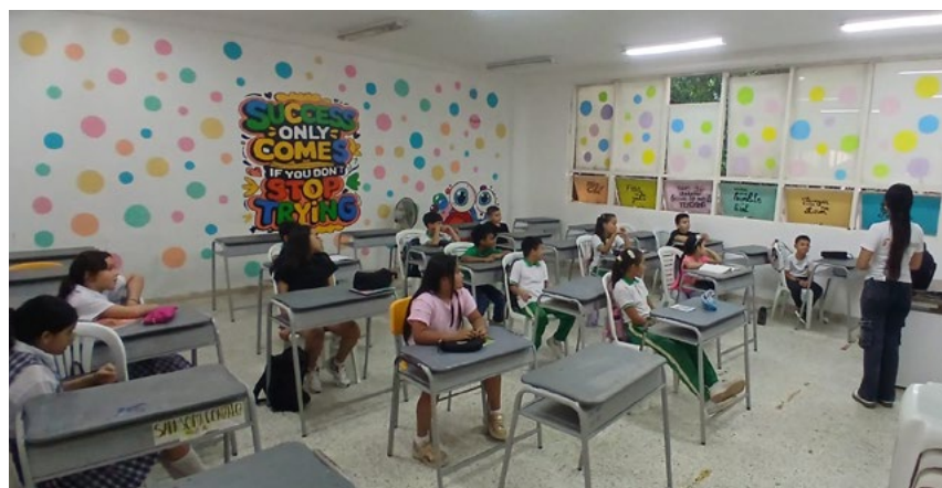
El módulo de Comunicación y Periodismo se realiza en el San Juan Bosco gracias a FUNDAUTRAHUILCA.