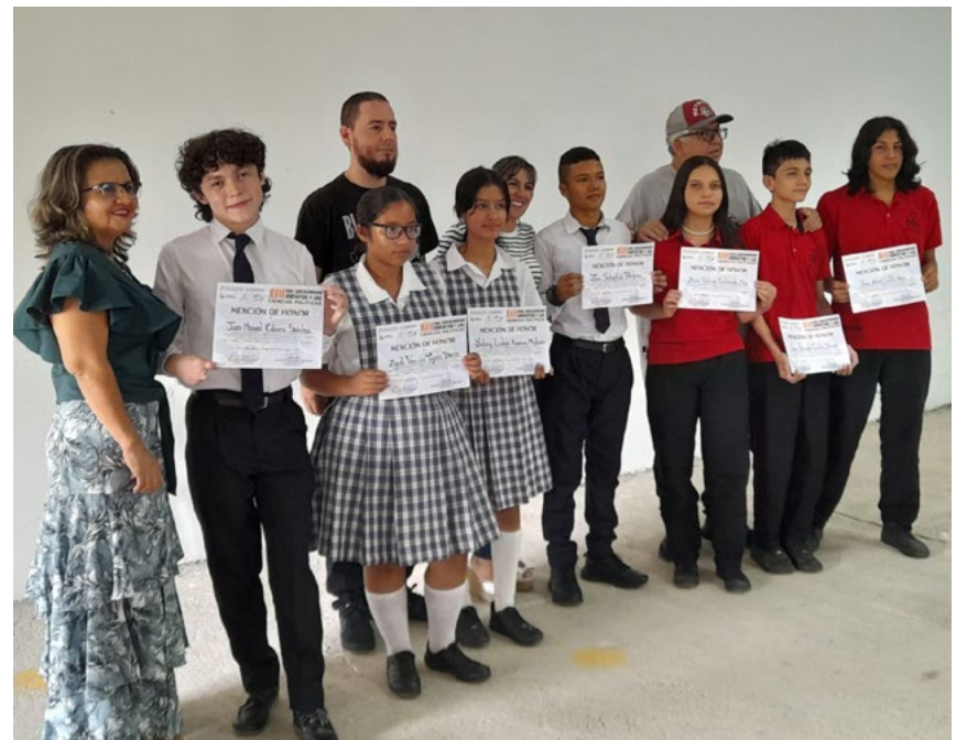
Cada estudiante e institución participante recibirá un certificado al culminar el evento.

El tema central de esta décima quinta edición no es menor: “Juventud y defensa del territorio frente a las políticas intervencionistas de las potencias globales”. Bajo esta premisa, los estudiantes deberán