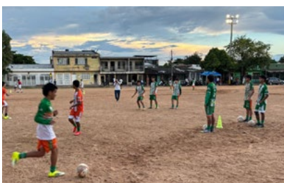
En torneo categoría élite lo integran los mejores equipos del Huila.

de los padres de familia, quienes cumplen una labor fundamental, “tenemos una responsabilidad grande que es la formación de seres humanos íntegros, no se trata no solo conceptos de fútbol, la parte física o técnica sino también es la formación, y es lo que le habló todos los días a los muchachos en la cancha, necesitamos buenos seres humanos y grandes deportistas”, puntualizó.