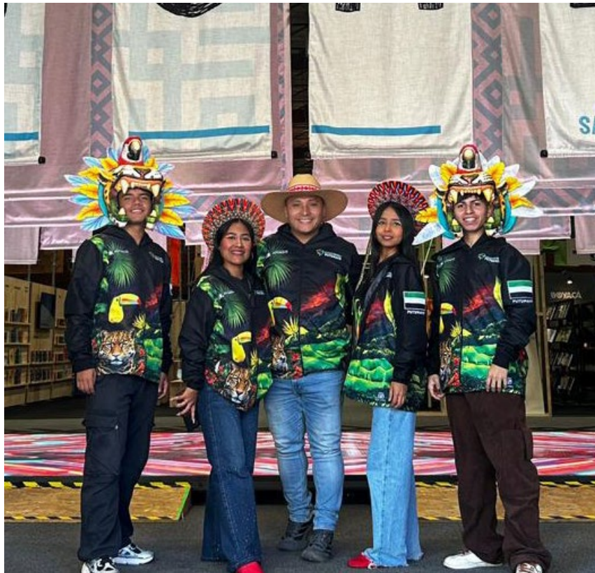
Tukuikuna participó artísticamente en la reciente edición de la FILBO 2026