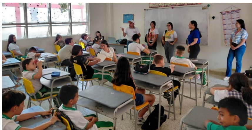
Durante la apertura del taller representantes de la Fundación UTRAHUILCA y la cooperativa UTRAHUILCA.

“Agradecer a la Fundación Social UTRAHUILCA por este apoyo tan valioso de estas asesorías donde se logra un trabajo en conjunto”