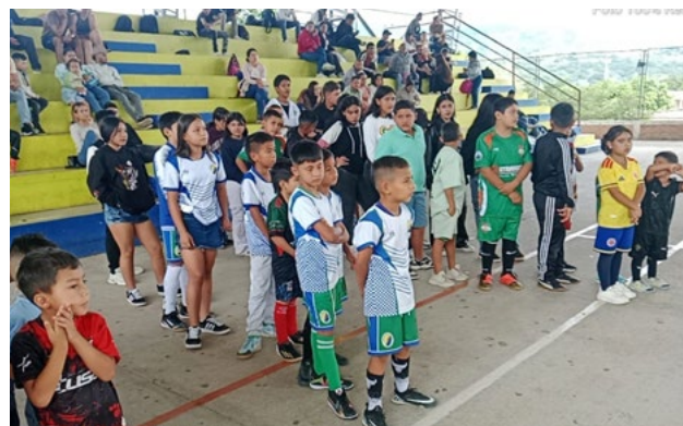
Los clubes utrahuilqueños participan en cada una de las categorías.

club deportivo Siglo XXI de UTRAHUILCA en Elías.