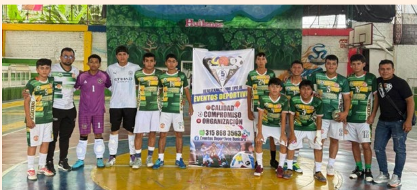
Subcampeones UTRAHUILCA en el municipio de Algeciras.

Con la participación de los municipios de Tarqui, Isnos, Pitalito, San Agustín, La Plata, Neiva y Algeciras se cumplió el Torneo Departamental de Fútbol de Salón Masculino categoría sub 17