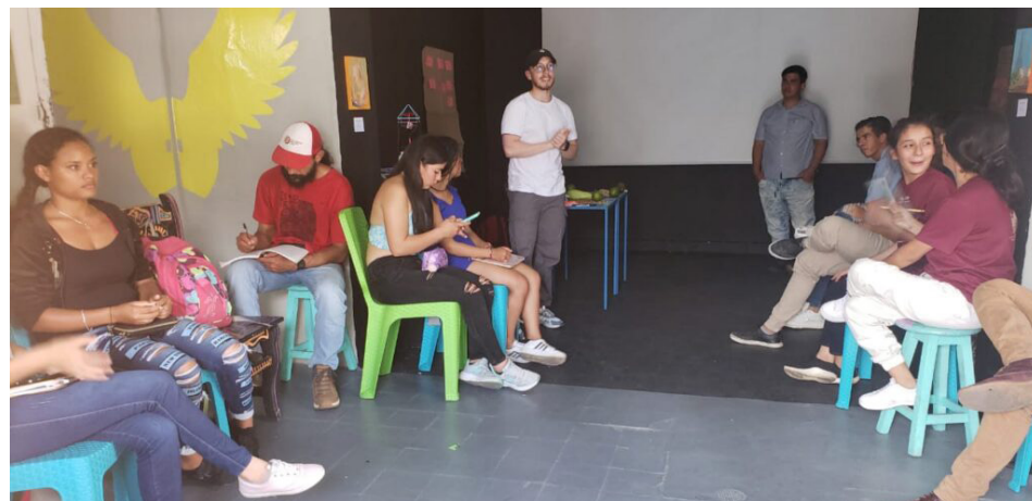
Para cumplir con el objetivo de la RENAF, el Comité dinamizador sigue trabajando de la mano con las regiones e incidiendo en las políticas nacionales.

Lo anterior, realizado en un ejercicio de seguimiento y acompañamiento que la Red Nacional de Agricultura Familiar, RENAF, ha estado haciendo con los jóvenes del territorio de Putumayo; y que permitió conocer y aprender de