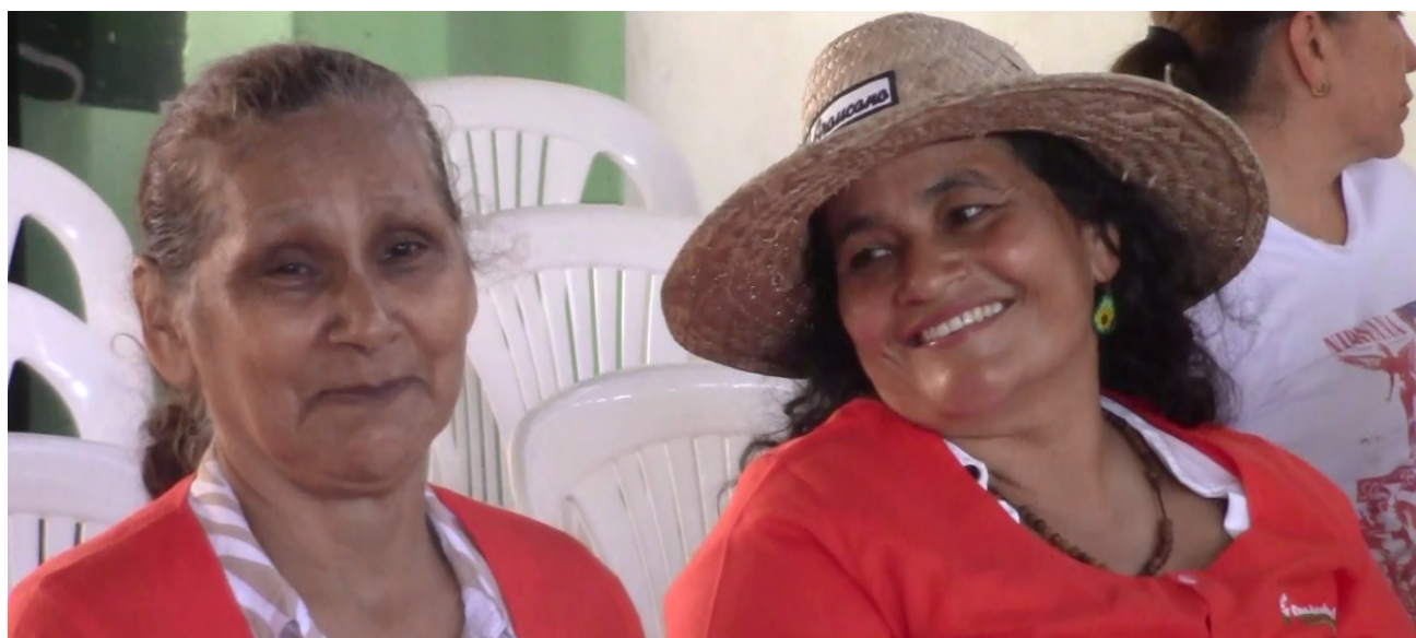
Llenas de alegría al ser reconocidas en su día.