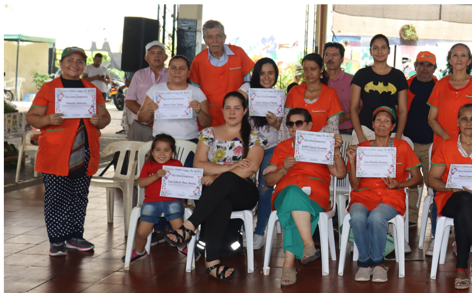
Ellas y ellos hacen posible que los productos de calidad lleguen a nuestros hogares.