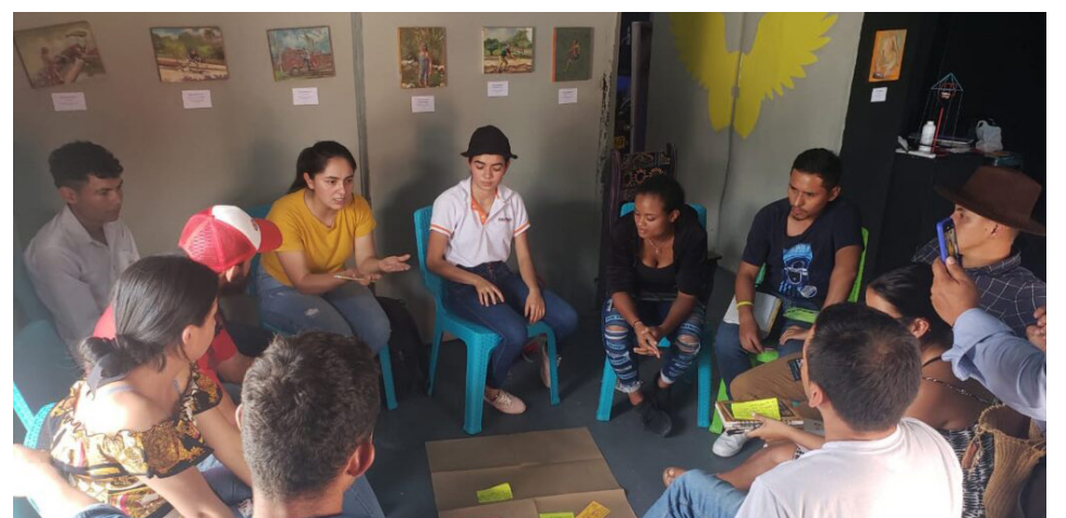
La reforma agraria se fortalece gracias a los aportes de los jóvenes campesinos del país.