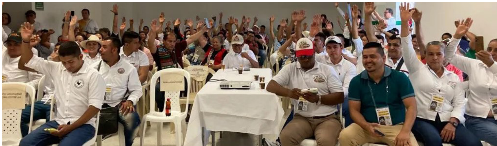
Los participantes afianzaron el tejido social a través de los saberes ancestrales y técnicas vanguardistas sobre la producción de Café especial.