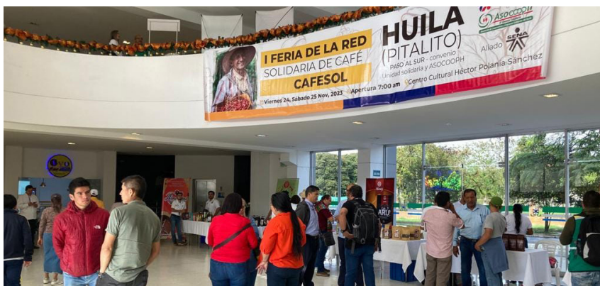
FUNDAUTRAHUILCA fue destacado como aliado estratégico en la construcción de redes y en la visualización de los procesos en la región.

La actividad cafetera realizada en la capital laboyana, se desarrolló en dos escenarios; el primer espacio fue la agenda educativa que contó