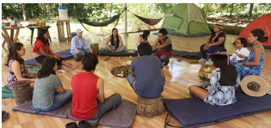
Los próximos encuentros con los jóvenes de la RENAF serán en los Nodos de Huila y Cundinamarca.

De esta manera el Comité Dinamizador de la RENAF sigue fortaleciendo el trabajo de las organizaciones de base para poder avanzar en el cambio político para el país.