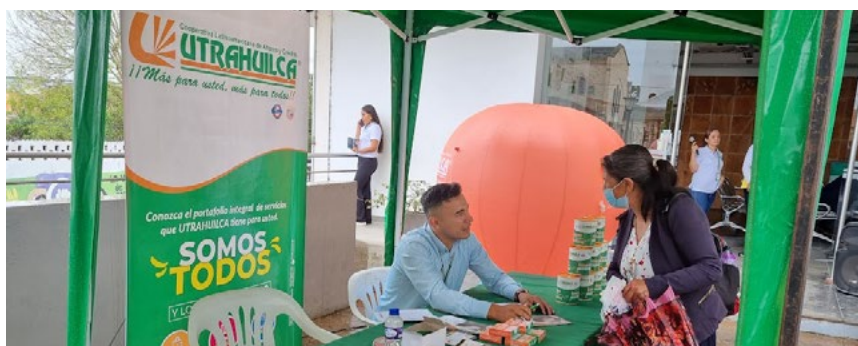
Las personas desean conocer siempre los beneficios que ofrece UTRAHUILCA.

Ambas agencias continúan desarrollando positivamente su plan de trabajo de la mano con asociados y asociadas.