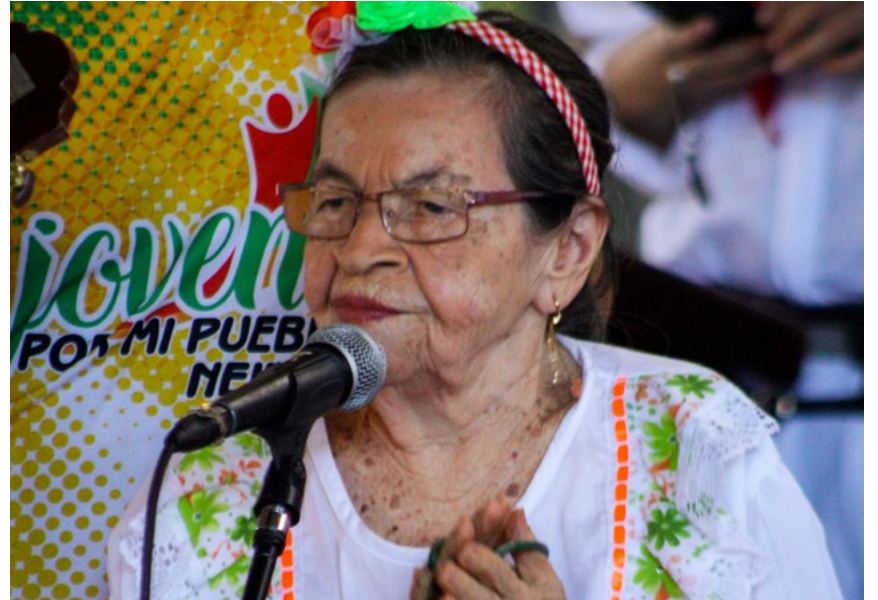
Las abuelitas de Remembranzas entonaron unos excelentes rajaleñas.

La picaresca opita formó parte de las diferentes presentaciones hechas por jóvenes y adultos mayores.