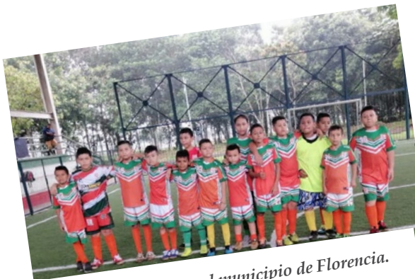
Escuela de fútbol en el municipio de Florencia.