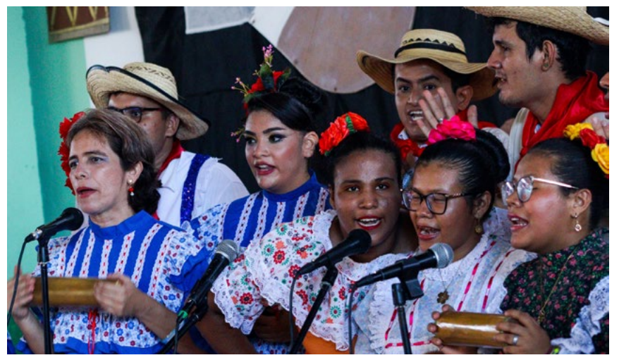
Los integrantes del programa de educación especial gozaron con sus presentaciones.