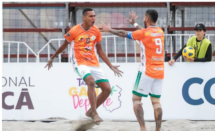
La familia utrahuilqueña envía un saludo de reconocimiento por el esfuerzo que hicieron cada uno de los jugadores..

“El microciclo va del 20 de junio al 30 de junio, el 30 viajamos a el Salvador en donde se disputaran los juegos centro americanos, la competencia va del 2 de julio hasta el 8 de julio, y pues tenemos las expectativas muy altas e iremos por la medalla de oro. Luego los juegos Centrosur en Santa Marta, y seguir trabajando para el mundial”, concluyó el delantero utrahuilqueño.