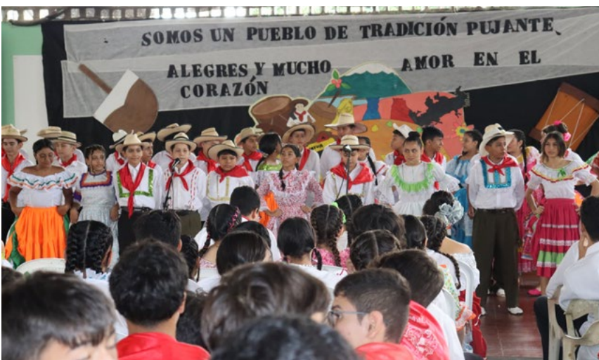
Estudiantes engalanaron el folclor del Huila.