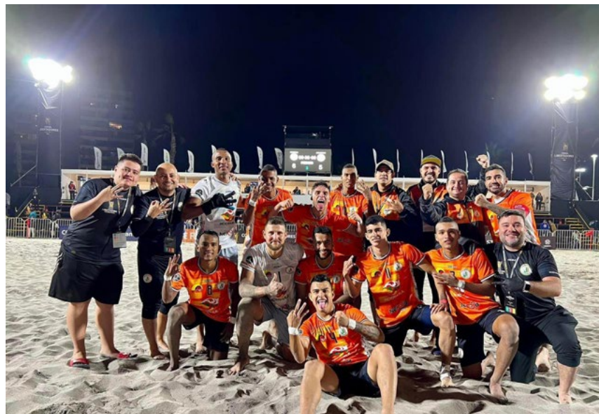
La copa Conmebol Libertadores se jugó en Chile con la participación de 12 clubes del continente.