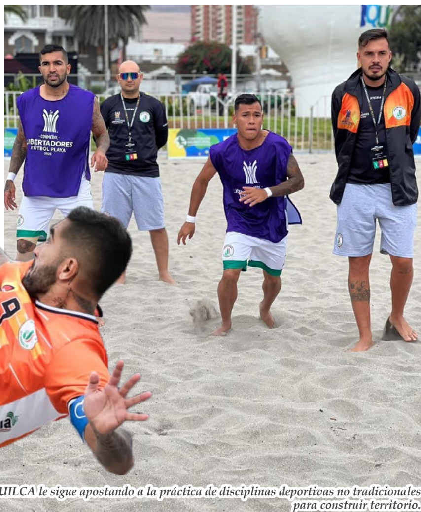
UTRAHUILCA le sigue apostando a la práctica de disciplinas deportivas no tradicionales para construir territorio.