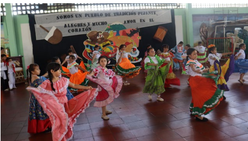
En su presentación los niños del grado segundo, quienes además hicieron un recorrido por los monumentos y sitios turísticos de interés en Neiva.