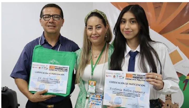
El departamento del Tolima también contó con su participación en el foro bajo la intervención de la I. E. Liceo Nacional.