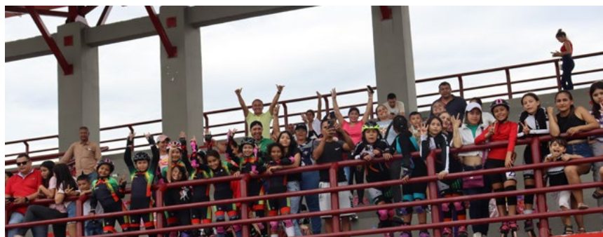
Niños y jóvenes de UTRAHUILCA listos para ser parte de la categorías de novatos y patín profesional.

De igual manera con este trabajo la entidad naranja, blanco y verde busca fortalecer esta disciplina en todo el territorio huilense, convirtiéndose este departamento en