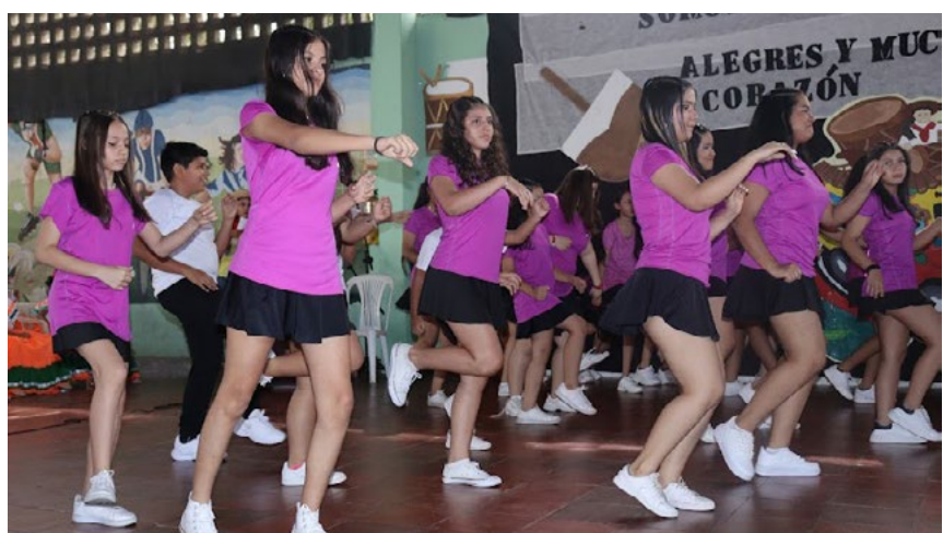
Integrantes de la lúdica juvenil en danza durante su presentación titulada 'Sabor Urbano'.