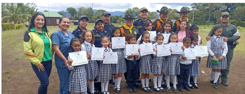
Niños y niñas fueron capacitados sobre educación ambiental.

Continuando con la línea de la actividad física, la Cooperativa se unió a una jornada de senderismo que culminó en el conocido Cerro