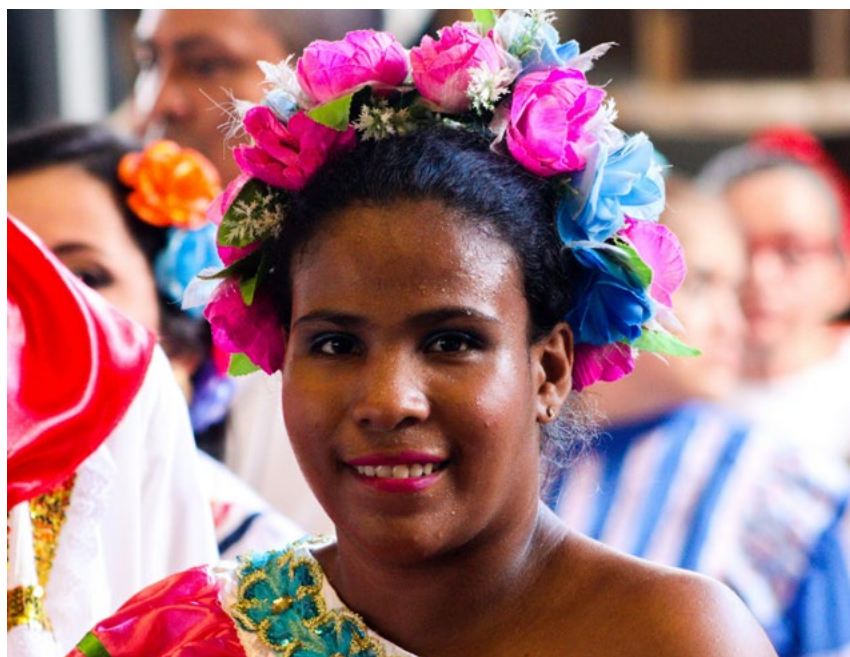
El color y la tradición de la cultura opita.

La misión para 2023-II continuará siendo la misma: la formación integral jóvenes y adultos mayores.