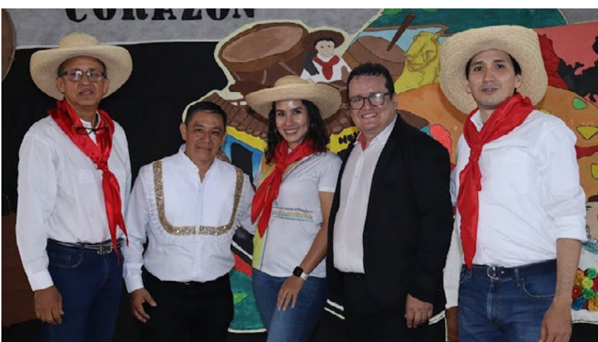
Un grupo de docentes selecto es el que tiene FUNDAUTRAHUILCA en Neiva.