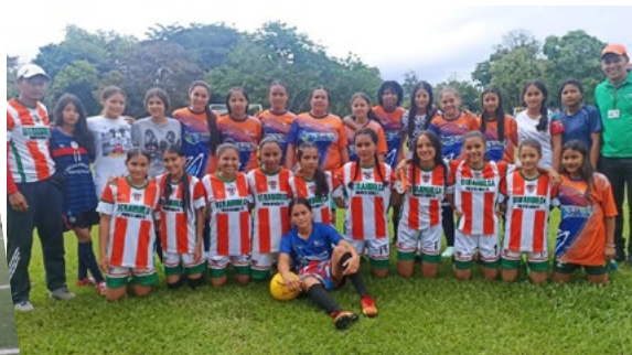
Un importante trabajo se viene adelantando desde el municipio de Puerto Rico en fútbol.