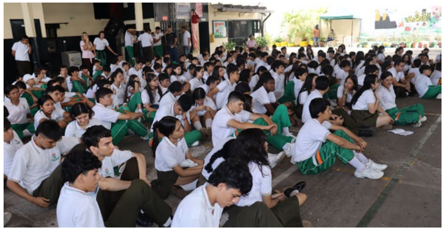
De manera organizada y atenta, estudiantes cumplieron la cita con el foro.