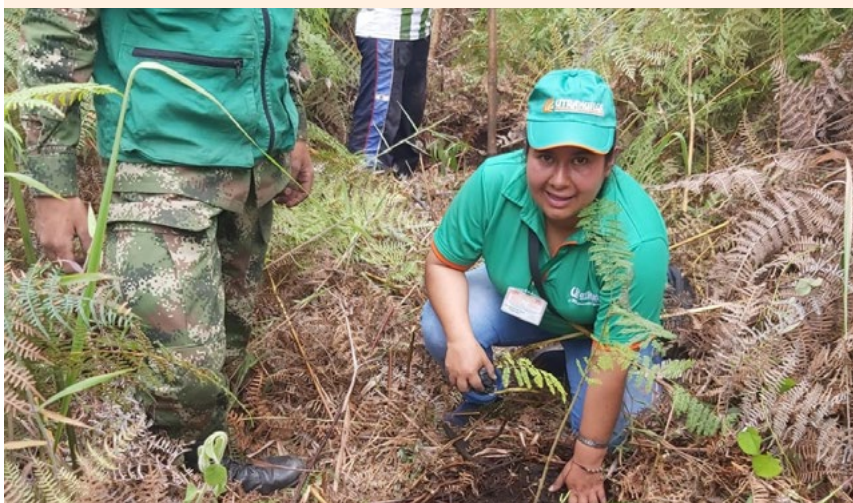
Pequeñas iniciativas que generan grandes cambios desarrolla la Cooperativa.