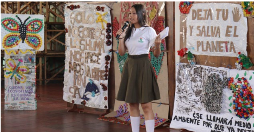
Estudiantes presentaron su ponencia en un escenario llamativo con un decorado ecológico con mensajes alusivos a la protección del medio ambiente.