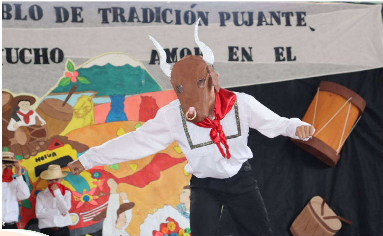
Canciones como El Barcino del compositor Jorge Villamil fueron presentadas en el escenario.

Estudiantes de grado Transición fueron los encargados de enseñar a los asistentes la preparación de parte de la gastronomía del Huila, como la elaboración del asado huilense, aloja, tamales, bizcochuelos, masatos, almojábanas y los tradicionales bizcochos de achira. Un gran cierre de periodo lleno de huilensidad, de esta manera los estudiantes le dieron la bienvenida a las vacaciones de mitad de año.