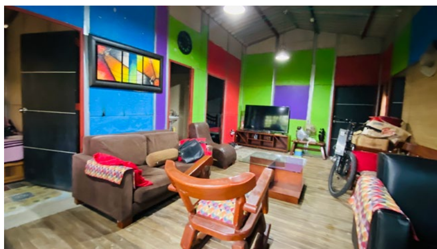
Este es un espacio familiar para conversar y descansar.