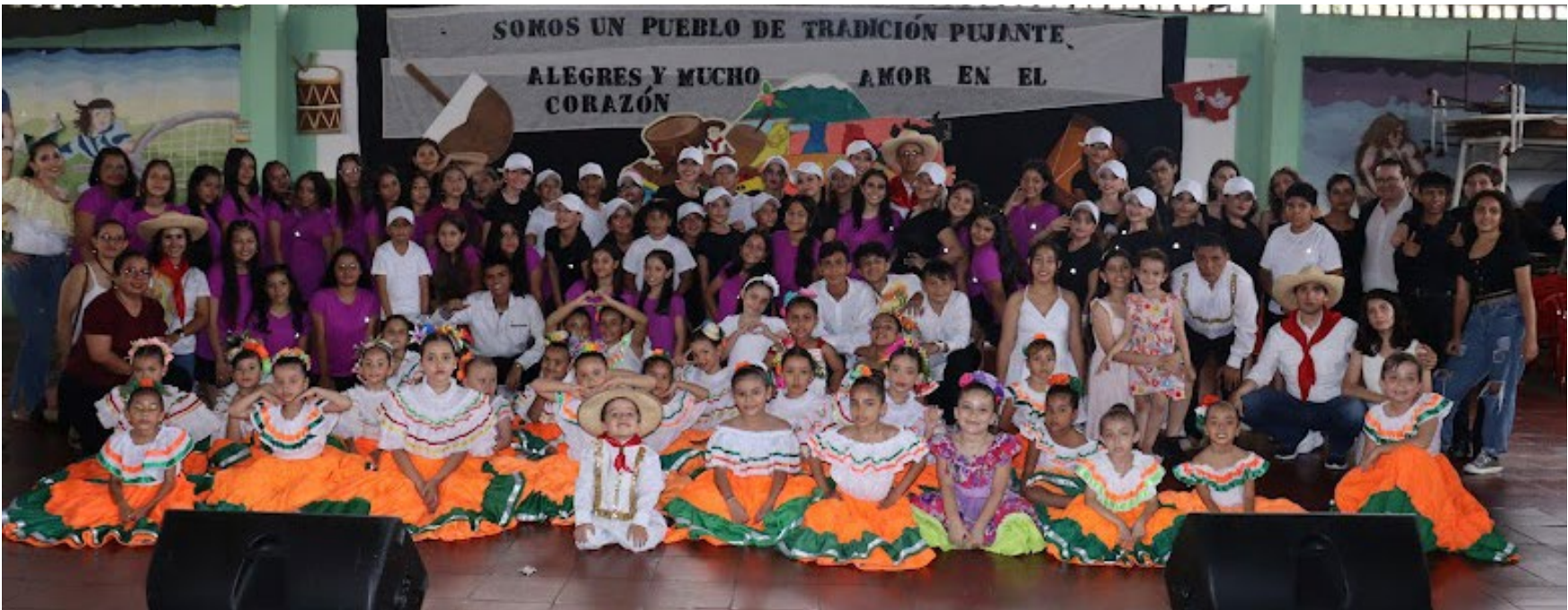
Además de la alegría y el talento de este grandioso grupo, se destaca en ellos el trato con gran familiaridad.