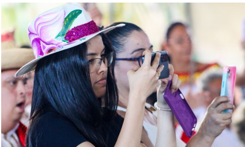
Nadie quiso perderse algún detalle de la clausura.