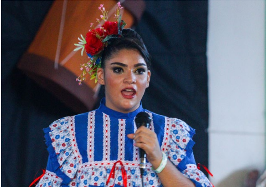
Al finalizar la actividad hubo espacio para fonomímica.