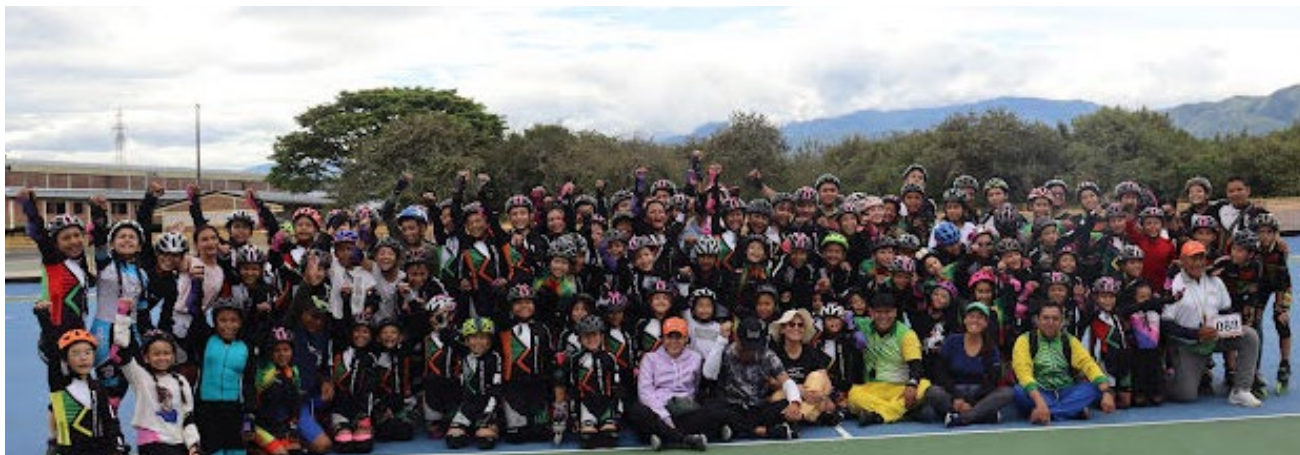
Se cumplió en Neiva una importante jornada de evaluación de rendimiento de los clubes de patinaje de UTRAHUILCA.

Pruebas de velocidad, técnica y habilidad se desarrollaron durante los dos días en el recién inaugurado patinódromo ubicado al sur de la capital del Huila, trabajos que permitieron al finalizar la jornada realizar un análisis de los procesos