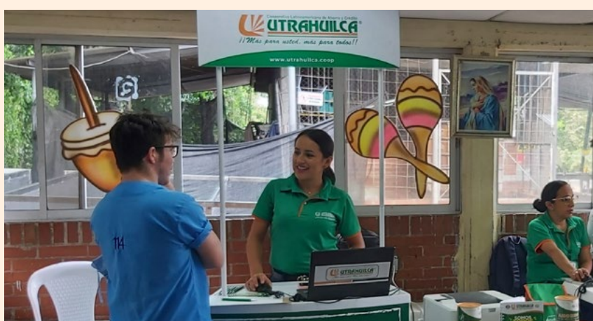
Siempre existe la disposición de escuchar a las personas.

La visita incluyó la entrega de detalles promocionales como agendas, alcancías y bolsos infantiles para los y las asistentes.