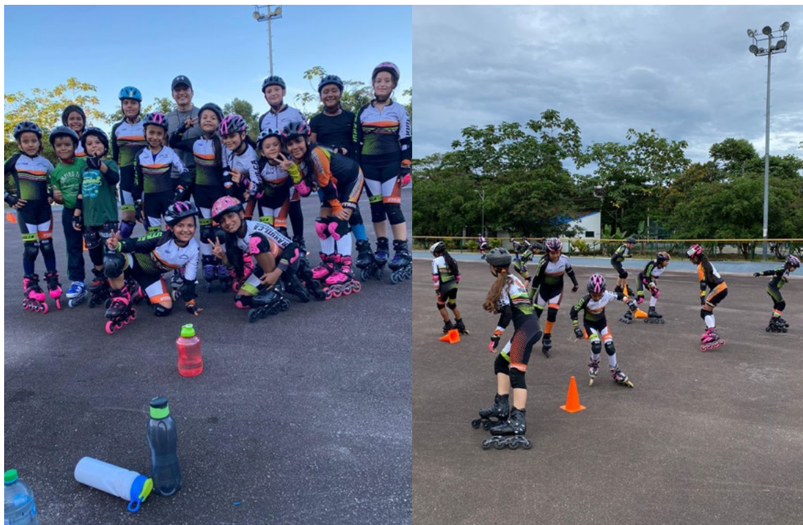
Patinaje se consolida en los municipios del Caquetá.

El deporte una herramienta transformadora que contribuye de manera directa en el aprovechamiento del tiempo libre de niños y jóvenes, de esta manera UTRAHUILCA a través de su Fundación Social UTRAHUILCA fortalece el trabajo deportivo en este departamento, abriendo la posibilidad de tener nuevas escuelas en otras disciplinas deportivas.