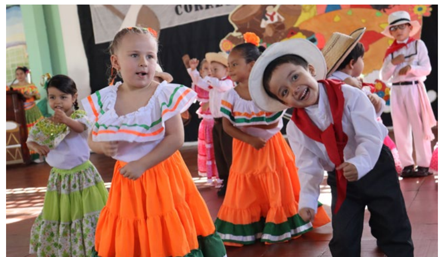
Estudiantes de grado Jardín mostraron las tradiciones del Huila.