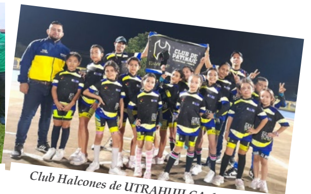
Club Halcones de UTRAHUILCA del municipio de El Doncello.

Un intenso trabajo de entrenamiento vienen cumpliendo las diferentes escuelas de formación deportiva de UTRAHUILCA en el departamento del Caquetá con miras a lo que será su participación a nivel departamental para el segundo semestre del año. Fútbol y patinaje se consolidan en este territorio solidario.