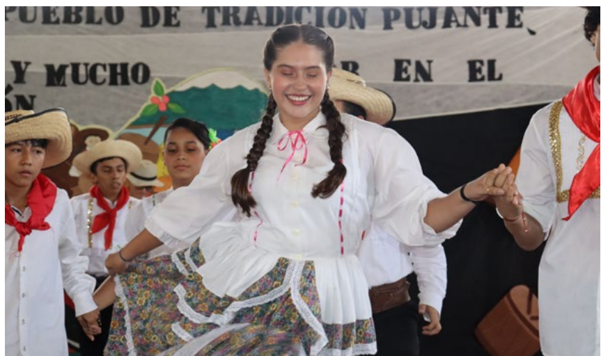
Alegría y mucho folclor opita.