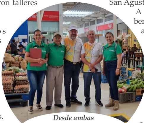
Desde ambas organizaciones se siguen promoviendo los mercados campesinos.

A lo anterior debemos sumarle el acompañamiento al acto de clausura del Programa de Desarrollo Rural con Educación Ambiental impulsado por el Fuerte de Carabineros del municipio. Además de la intervención musical de FUNDUATRAHUILCA, la entidad tricolor entregó detalles promocionales.