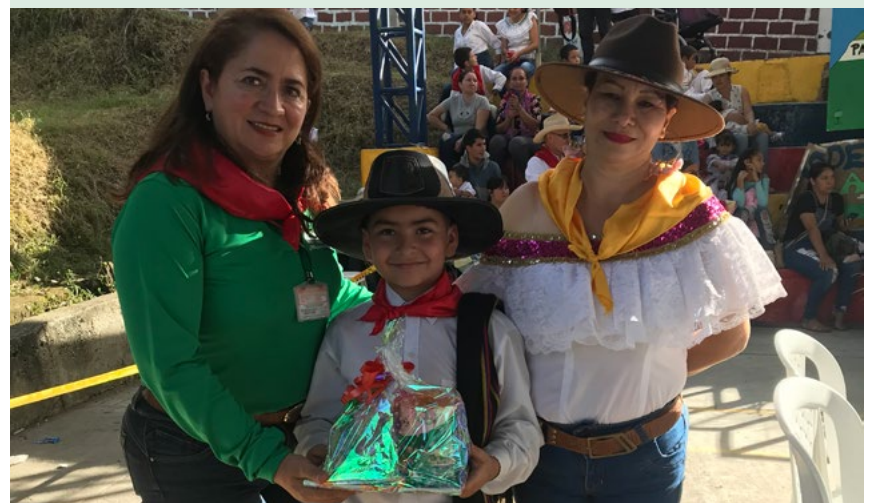
UTRAHUILCA, presente en las festividades de San Juan y San Pedro.

Por: Redacción agencia UTRAHUILCA Timaná