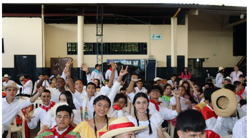
Muy atentos estuvieron los estudiantes durante la jornada.