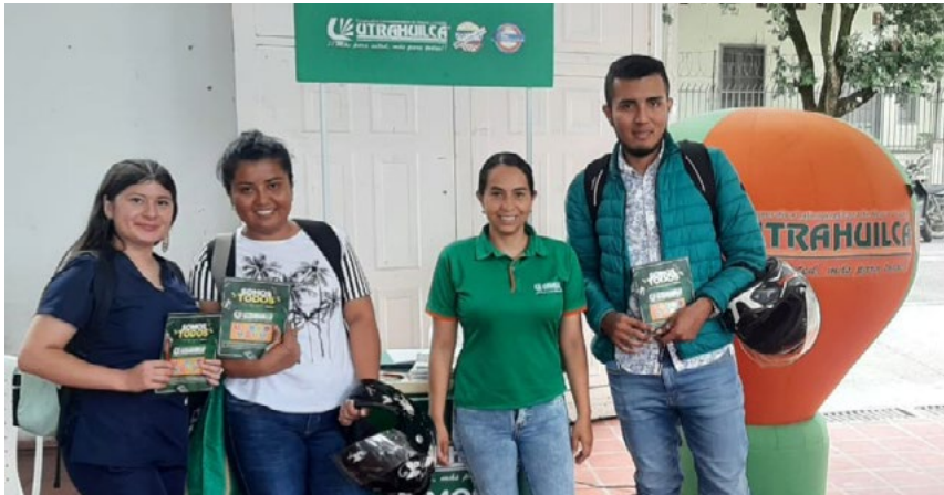
Más personas se interesan por formar parte de este proyecto.