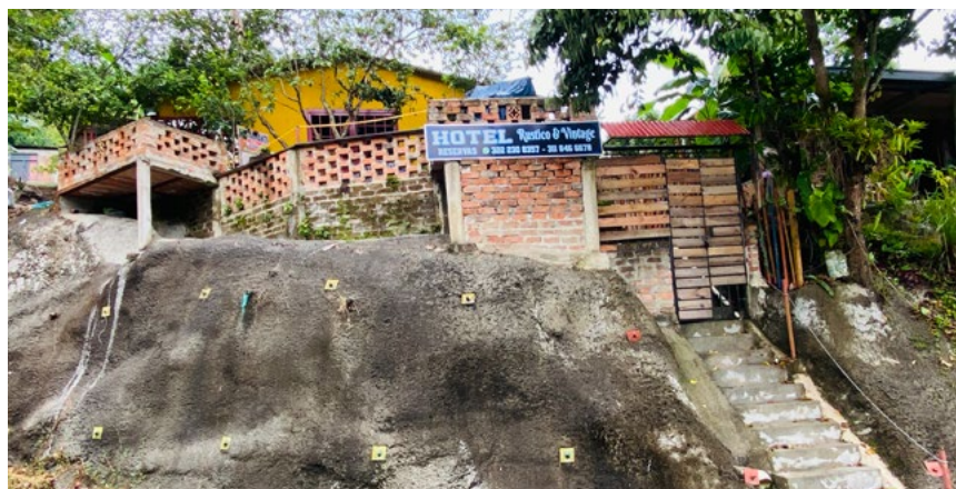
El Hotel Rústico & Vintage queda ubicado sobre la carretera que conduce al casco urbano de San Bernardo.