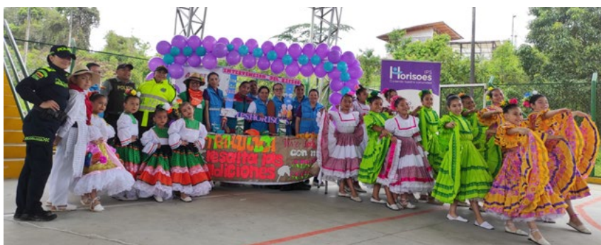
El toque artístico durante la celebración del Día del Adulto Mayor en San Agustín lo puso FUNDAUTRAHUILCA