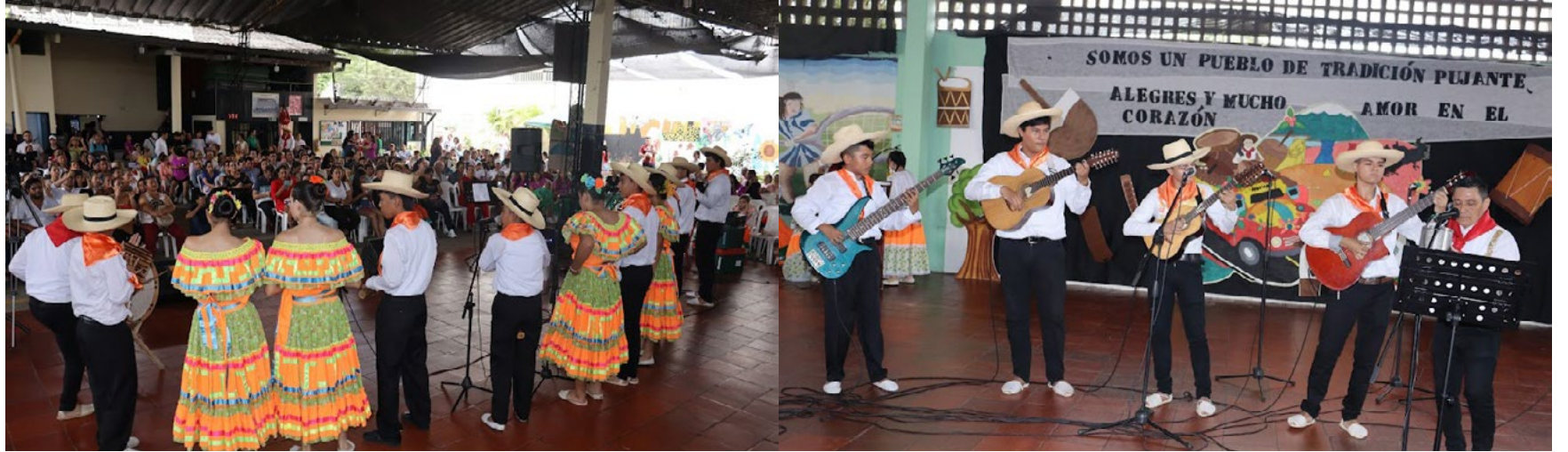
Los grupos de la lúdica de percusión y rajaleñas juvenil de Fundautrahuilca pusieron a gozar al público con sus interpretaciones.