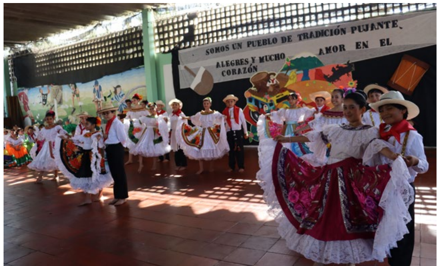
La interpretación del baile del sanjuanero huilense también hizo parte de la programación.