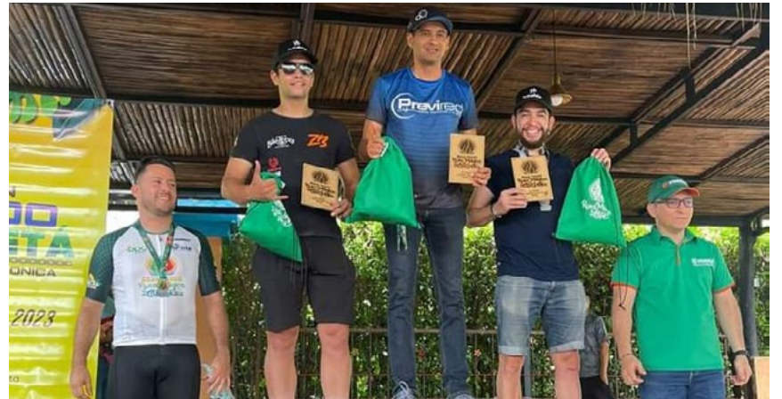
UTRAHUILCA impulsa la actividad física.

“Asistir a todas estas iniciativas es muy positivo para nosotros.