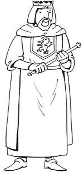
REY ALFONSO VI DE LEÓN